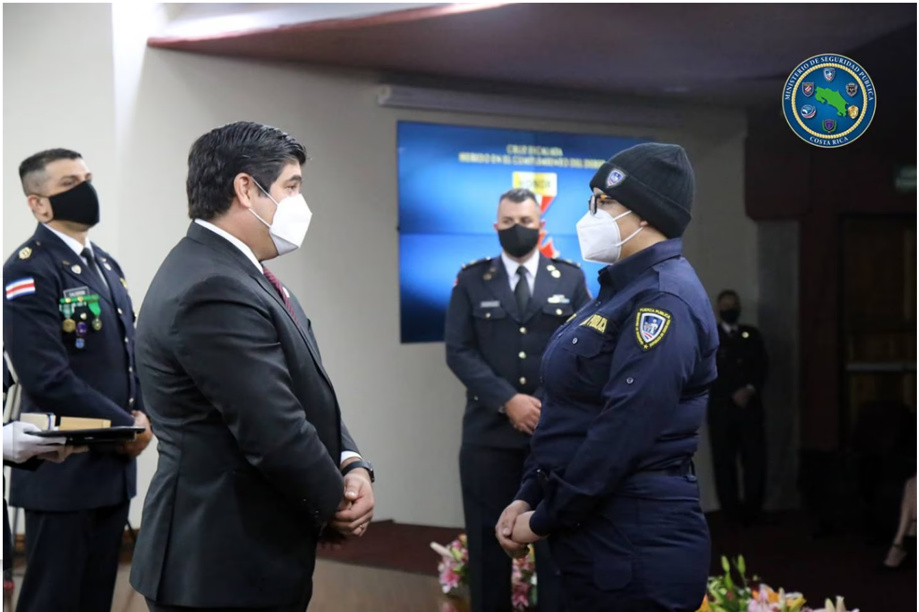
La oficial recibió la medalla de manos del presidente Carlos Alvarado.