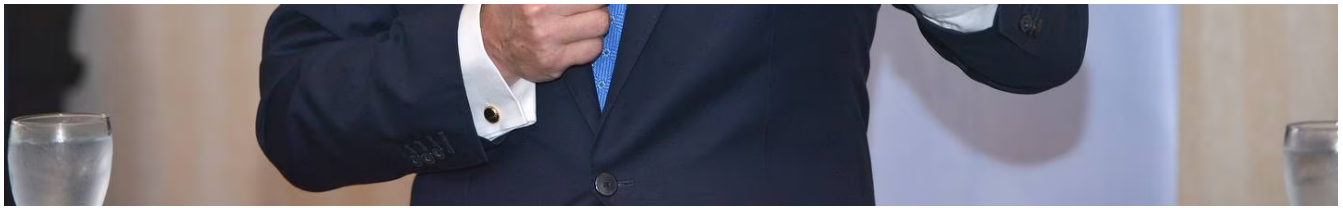
Rodrigo Chaves en conferencia de prensa sobre la denuncia de acoso sexual.

El candidato presidencial Rodrigo Chaves reveló, este martes, en conferencia de prensa, piezas escogidas del expediente con el que el Banco Mundial lo sancionó por denuncias de acoso sexual de dos subalternas suyas, en esta institución internacional. El político mostró conversaciones con las denunciantes , las cuales calificó de normales.