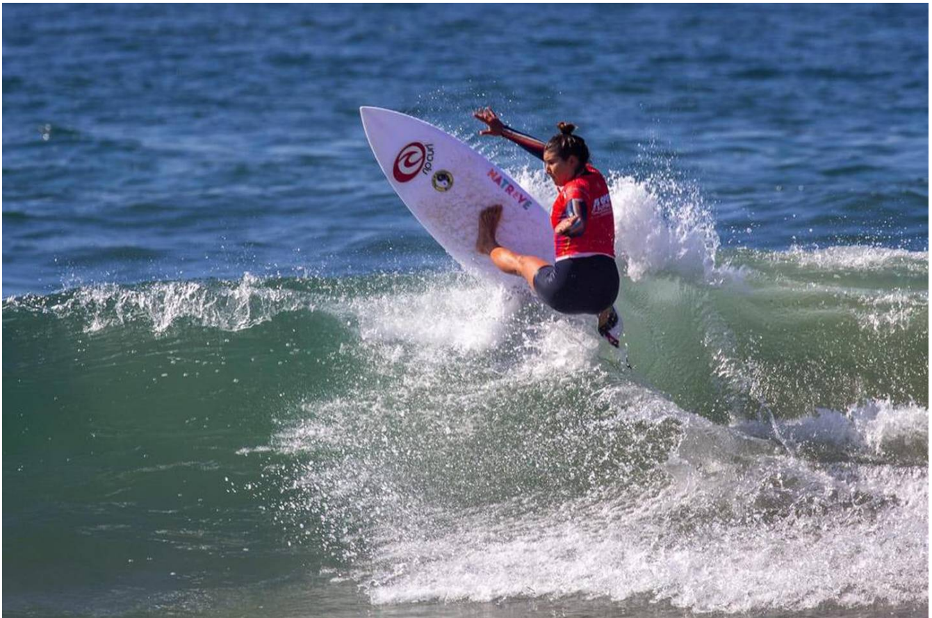
Brisa es una de las mejores surfistas del mundo.