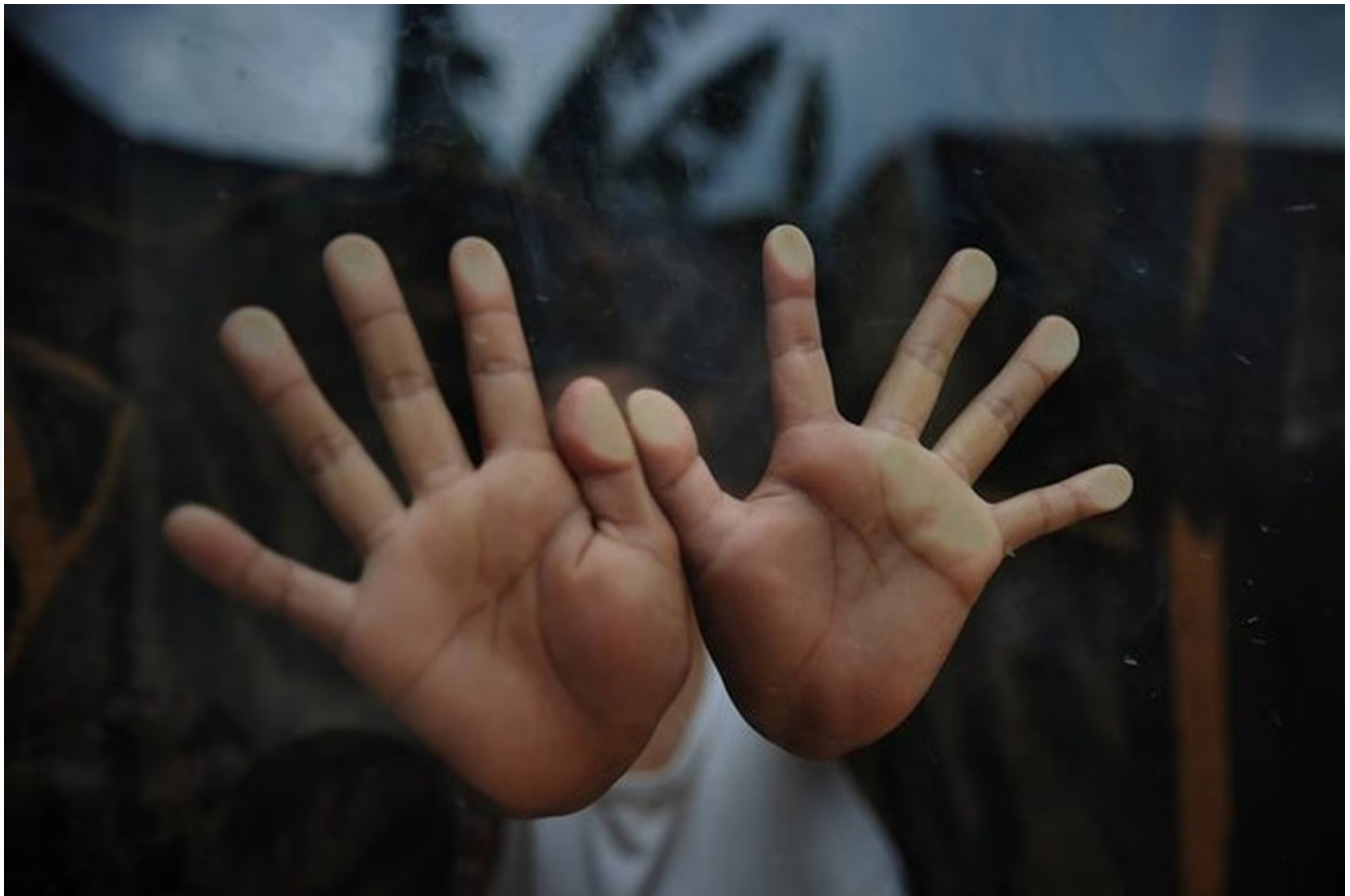
Un niño permanece hospitalizado, luego de ser víctima de agresión en Orotina.