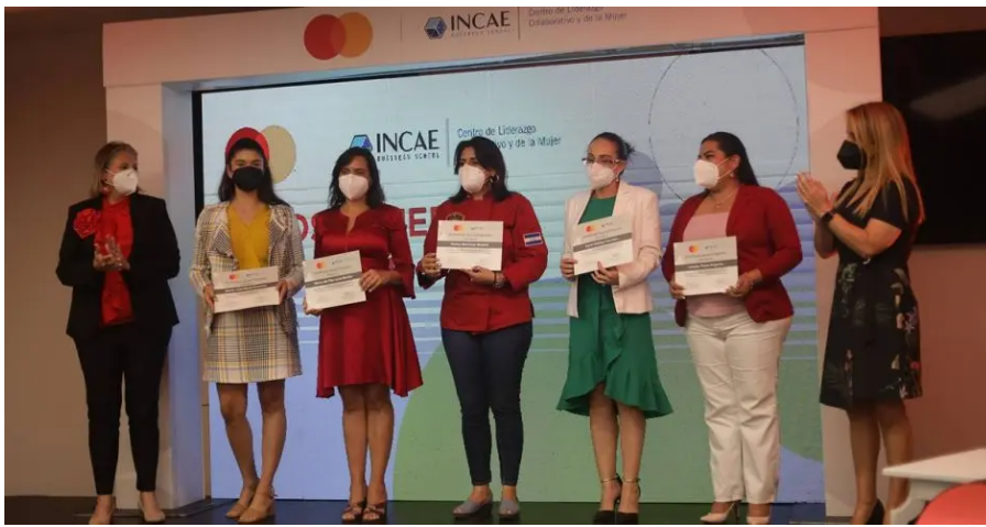
Ganadoras de Nicaragua, Honduras y Costa Rica se llevan premios en efectivo para impulsar sus proyectos de aceleración.