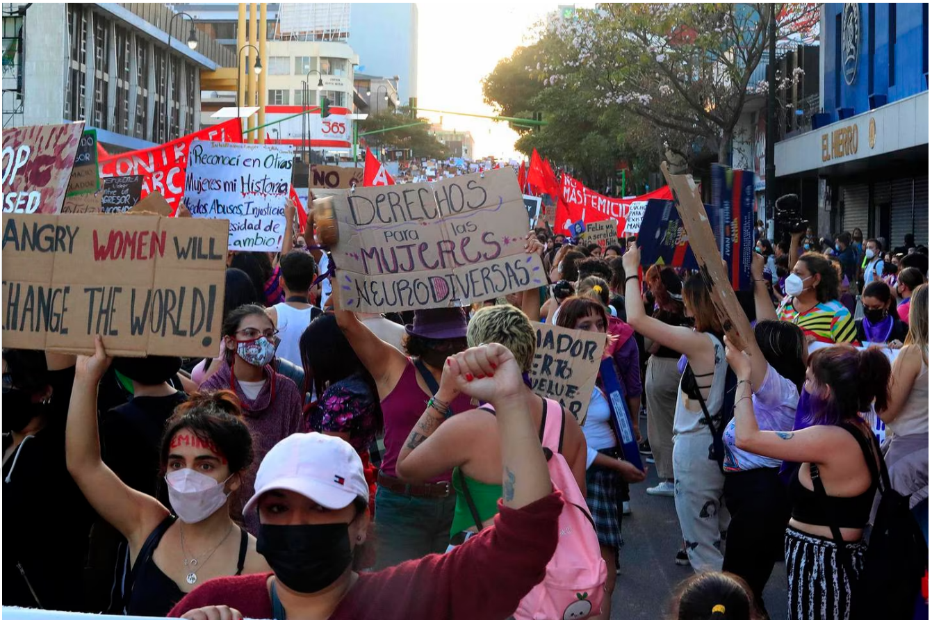
La idea de la marcha era pedir el fin de la violencia contra las mujeres, pero al final la marcha también terminó en violencia.