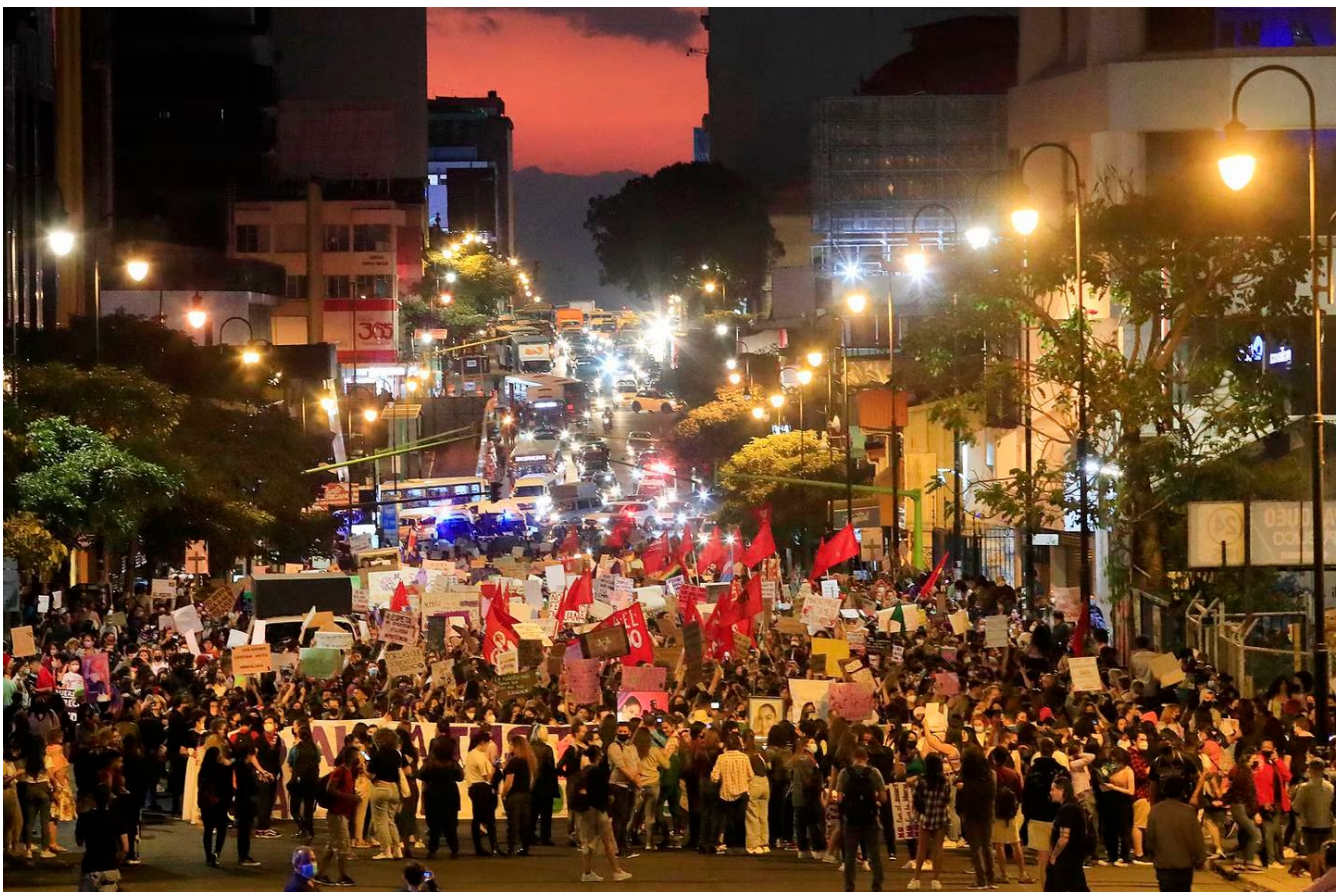
La marcha transcurrió con orden y paz, pero al final algunas personas cometieron actos de vandalismo.