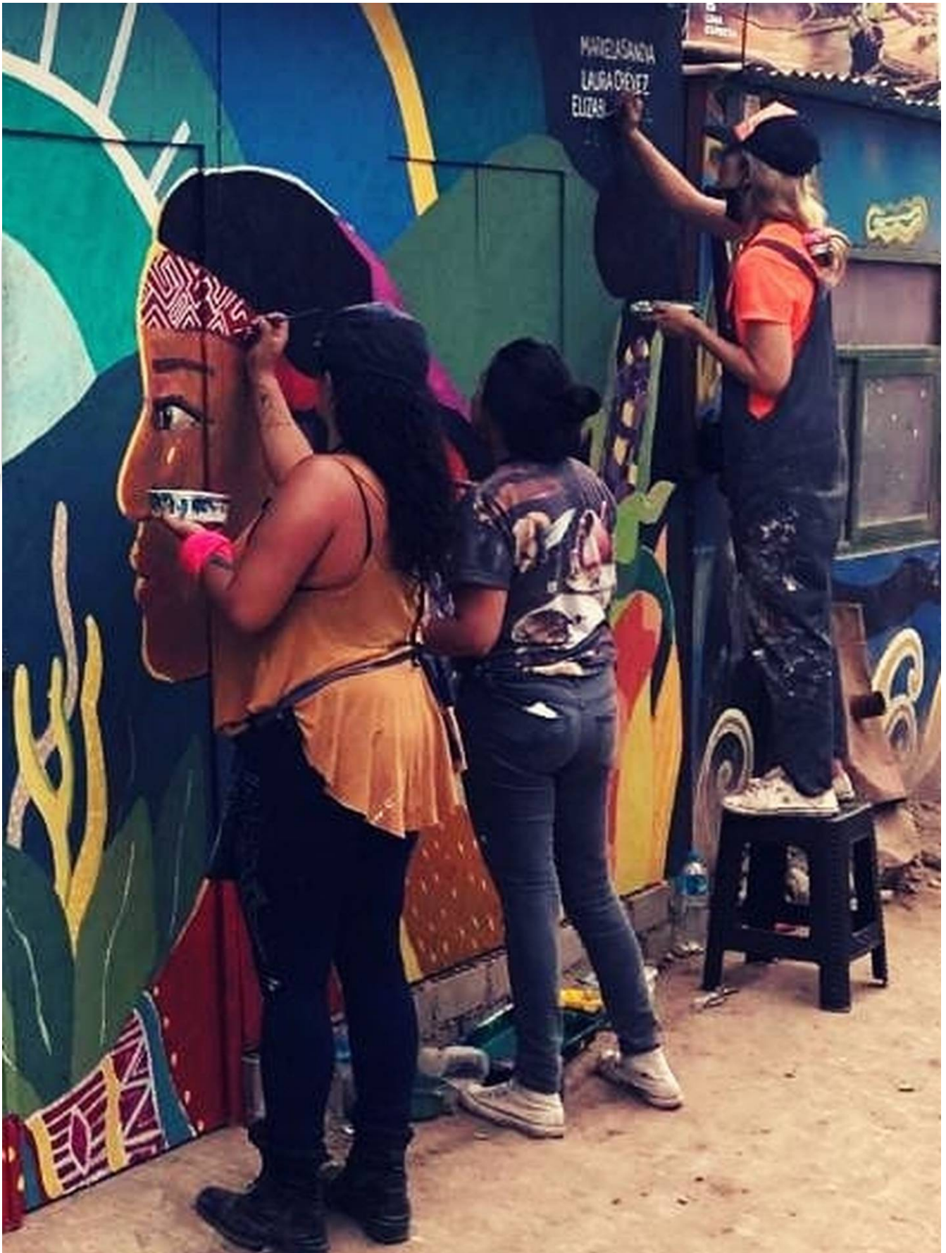
Las muralistas compartieron con artistas de Latinoamérica.