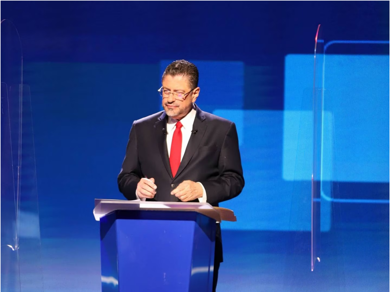
Rodrigo Chaves, de Progreso Social Democrático.

Fabricio Alvarado, de Nueva República, también le dijo a Rodrigo Chaves: “Nuestros economistas sí pueden ir a reunirse con el Banco Mundial, a diferencia de usted, que tiene que avisar antes de ir, para que las mujeres se alejen un poquito”.