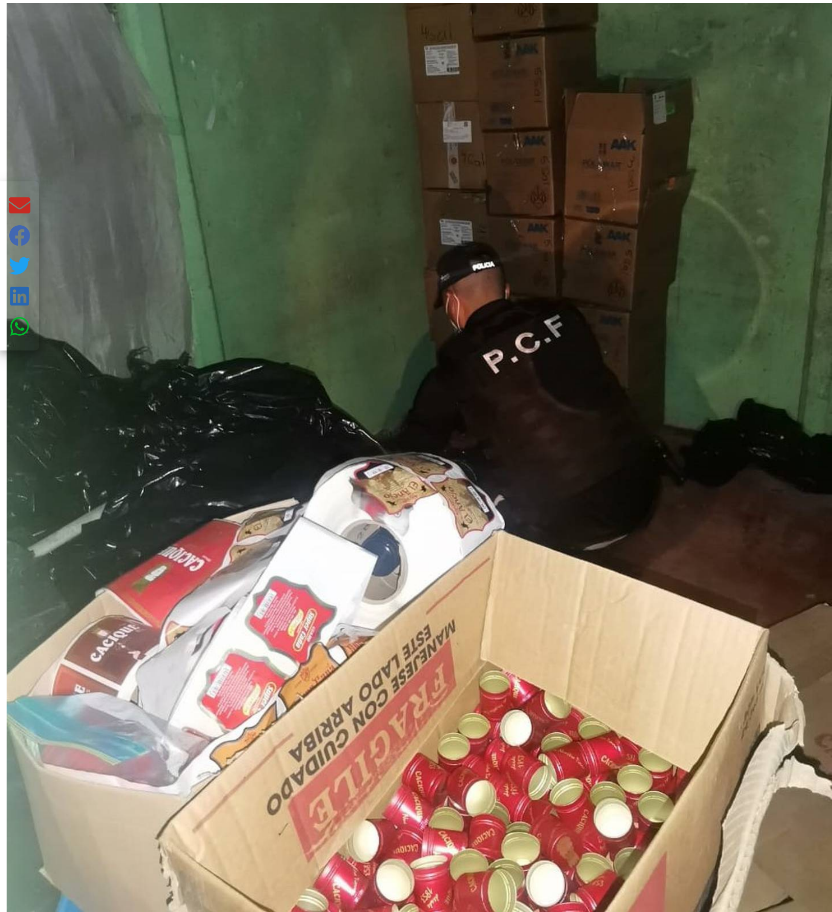
La policía encontró en el lugar producto listo para envasar.