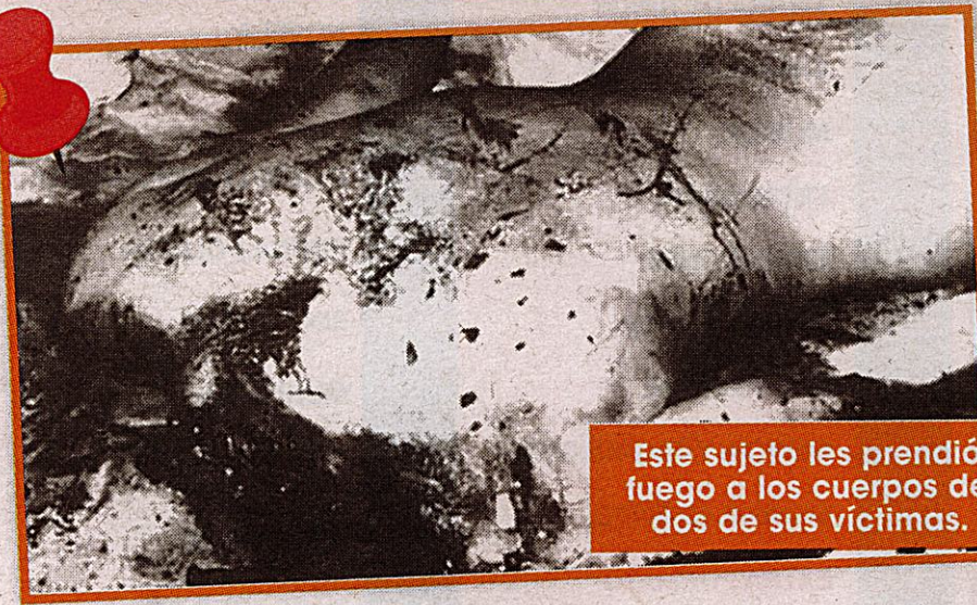
Este sujeto les prendió fuego a los cuerpos de dos de sus víctimas.

Queens, donde se deshizo del torso y por ejemplo sus piernas aparecieron a unas manzanas del lugar.