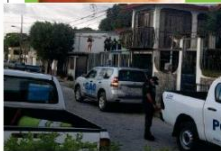
El femicidio ocurrió este jueves en Liberia.