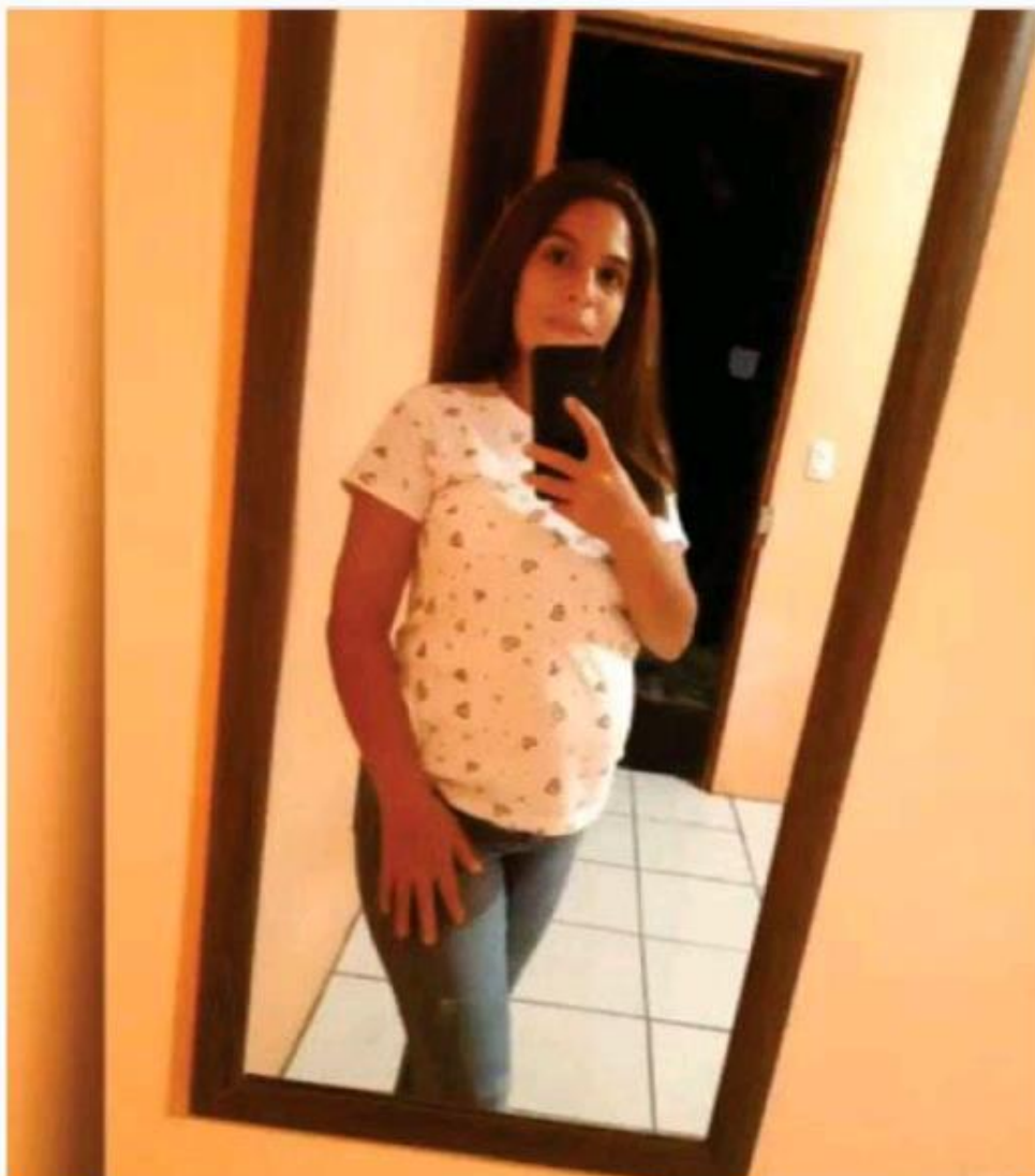
La joven mamá estaba muy feliz con su embarazo.