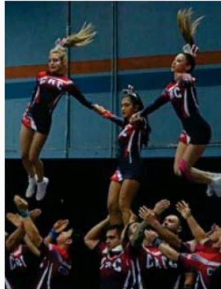
El grupo se presentará al medio tiempo.

7 sept. 2021 Yenci Aguilar Arroyo yenci.aguilar@lateja.cr