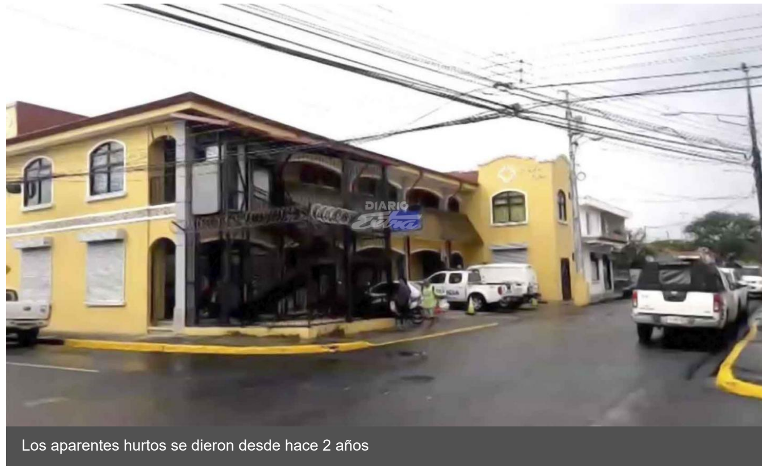
Los aparentes hurtos se dieron desde hace 2 años