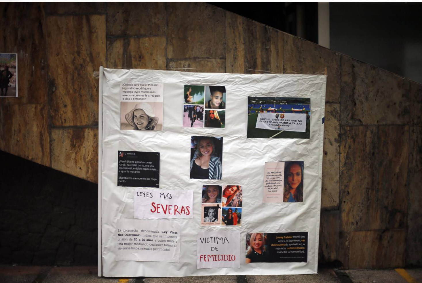
Con esta pancarta recordaron a muchas de las víctimas.