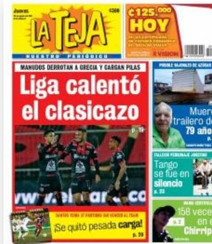
La Teja 26 agosto 2021 (5)