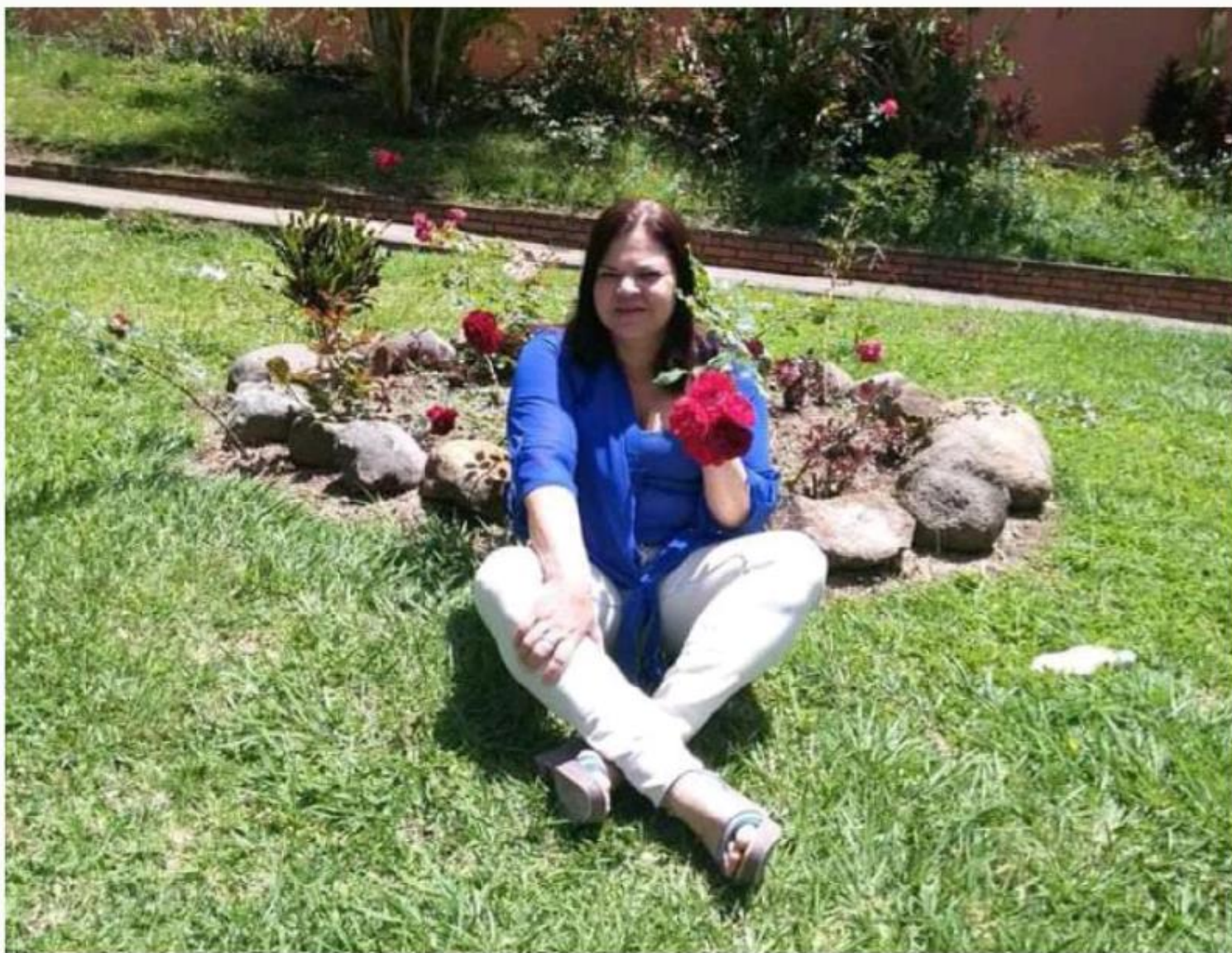
Durán tenía 56 años y sus allegados la recuerdan como una persona alegre y servicial.

”Incluso, un día antes de esto (el crimen) ella le dijo a la amiga que ya no confiaba en él, pero creo que nadie pensó que ese hombre fuera a hacer algo así (...)