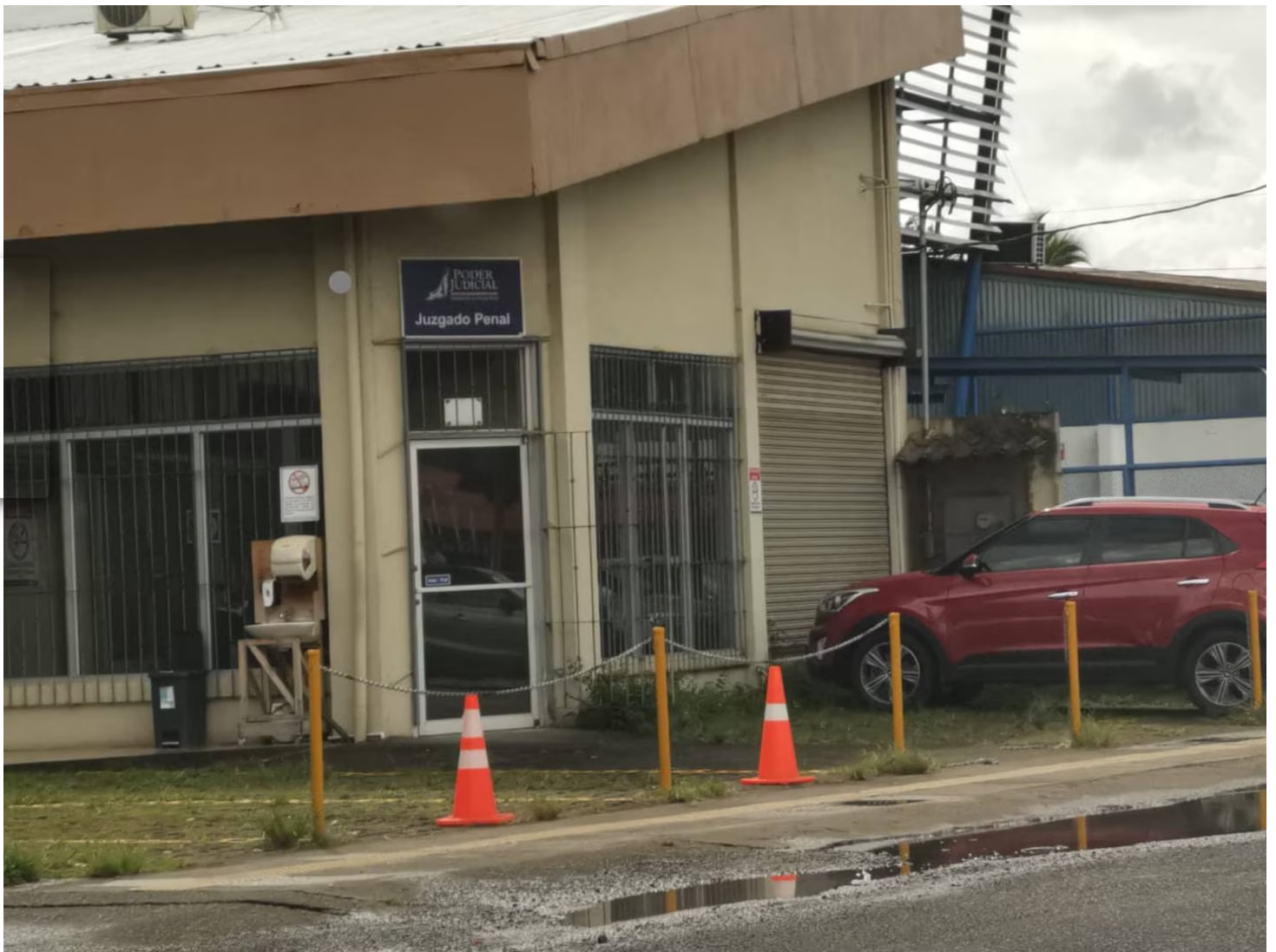
El Juzgado Penal de Sarapiquí dictó la medida el 25 de diciembre.

El Ministerio Público indicó que, el 25 de diciembre, la mujer no estaba en su casa, en Horquetas, por lo que el hombre aprovechó para meterse a la vivienda. Cuando ella regresó, vio a Villalobos y empezó una discusión.