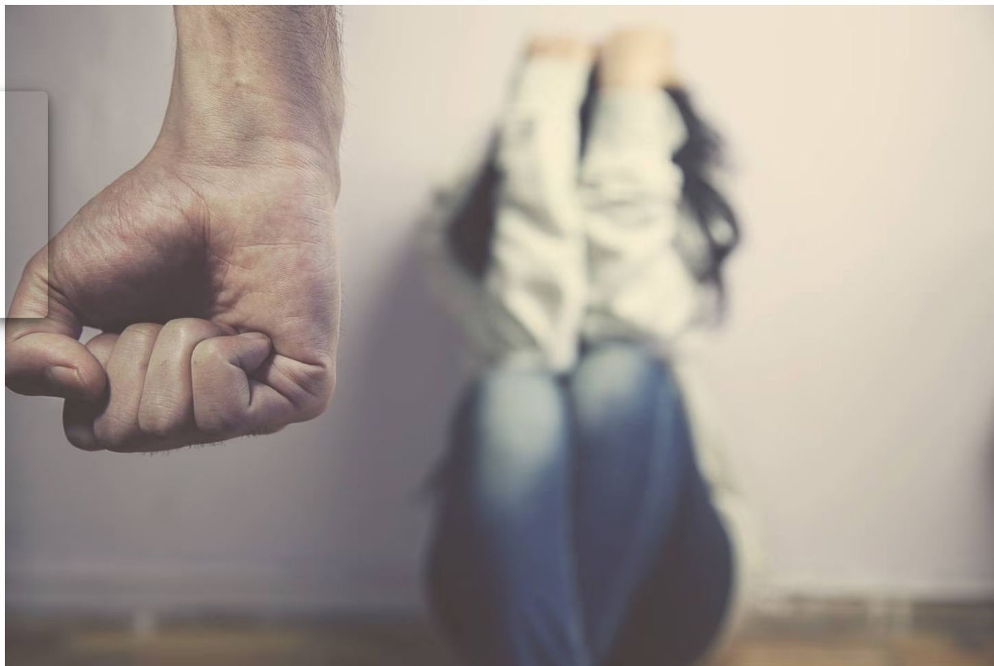
Padilla Peña desobedeció la orden de mantenerse largo de su expareja.

El expediente contra Padilla es el 22-000528-1259-PE.