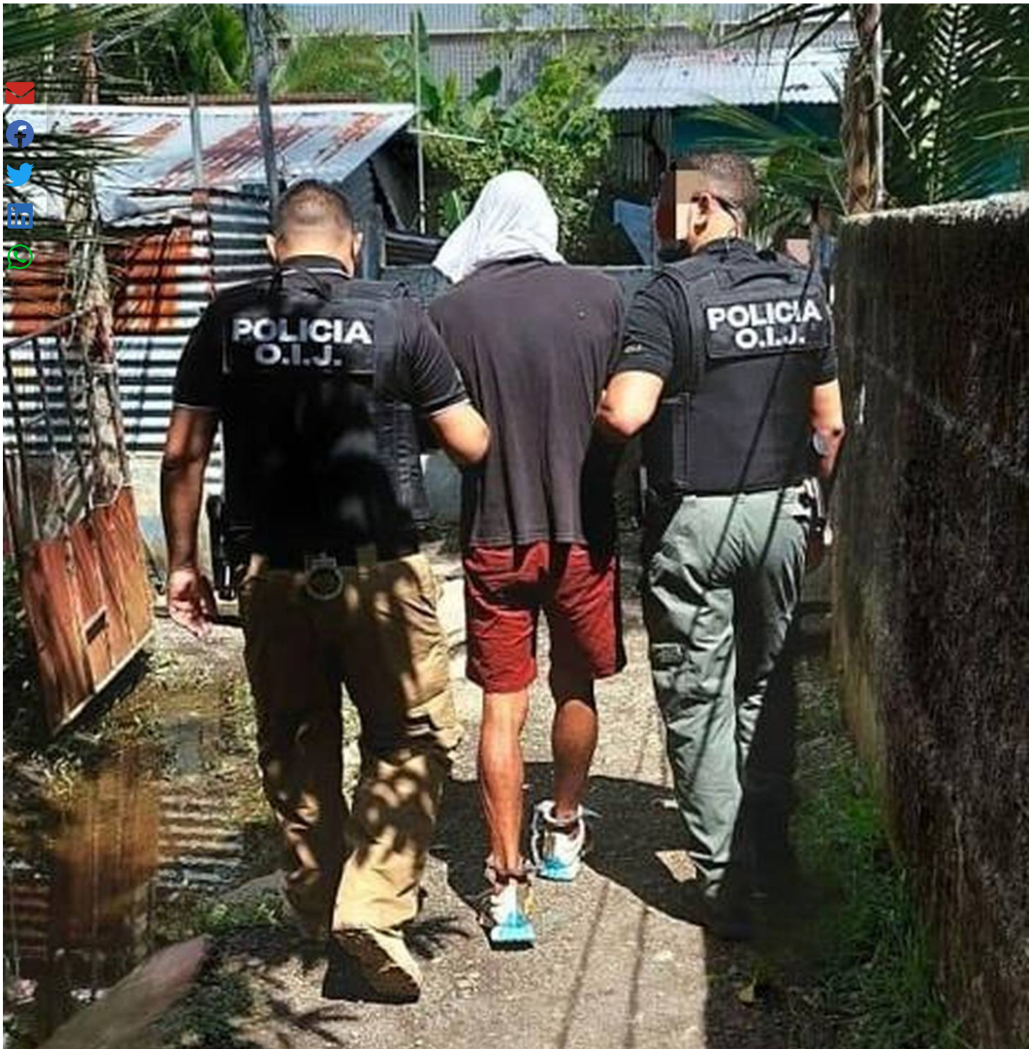
El sospechoso fue llevado este sábado a su casa en la comunidad de Paquita, en Quepos, donde se realizó el allanamiento de la propiedad.