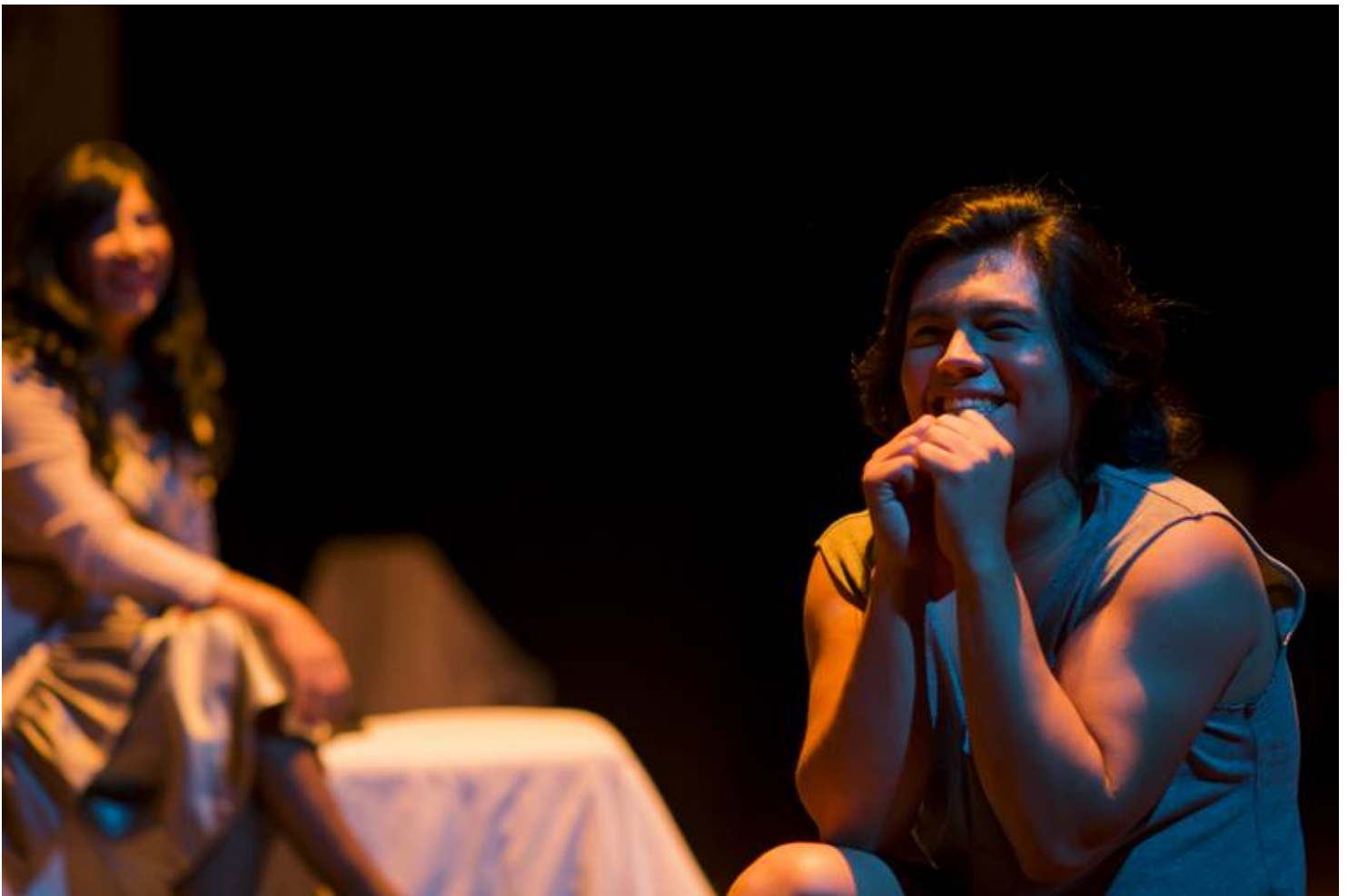
'La huida' se estrenó originalmente en el 2017. (William Eduarte)

A partir de allí se desarrolla la obra de teatro La huida , una producción que busca poner sobre la mesa la realidad de desplazamiento forzado debido a orientación sexual e identidad de género, la cual viven muchas personas en el mundo.