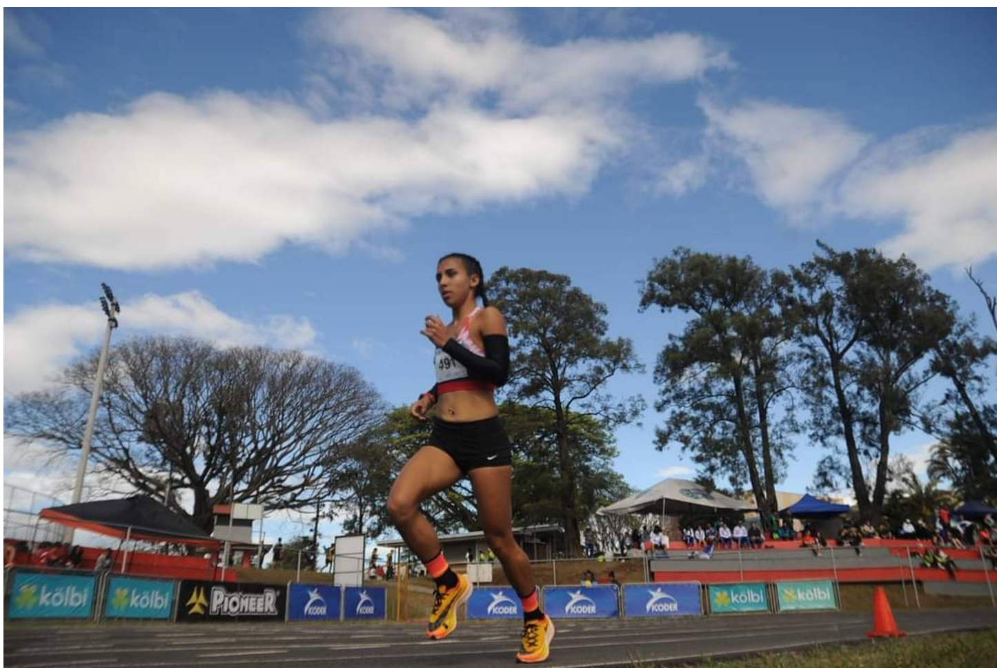
Aquí va con paso firme al oro de los 800 metros planos Sub-23.

En la prueba de 5.000 metros planos, Yuditza ganó oro para San Carlos con un tiempo de 19 minutos, 7 segundos y 90 centésimas; la medalla de plata la ganó Salma Villatoro Cantarero de Pococí (19:58'48") y el bronce se fue para San José, lo ganó Ana Victoria Calderón Zúñiga (21:42'46").