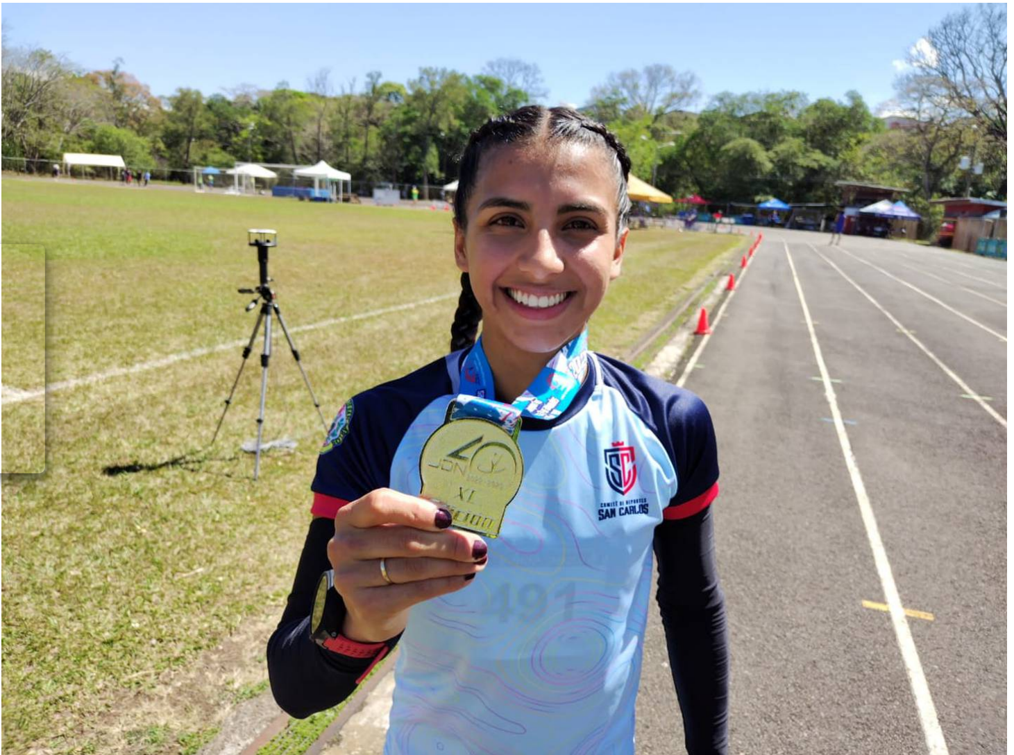
Yuditza es todo pasión por el atletismo y este 2023 se despidió de Juegos Nacionales.

Después de tremendo esfuerzo conversamos con la medallista de oro, quien nos confirmó que su gran pasión es el atletismo y que para mantenerse competitiva y salir adelante con todo lo que necesita en este deporte trabaja limpiando casas .