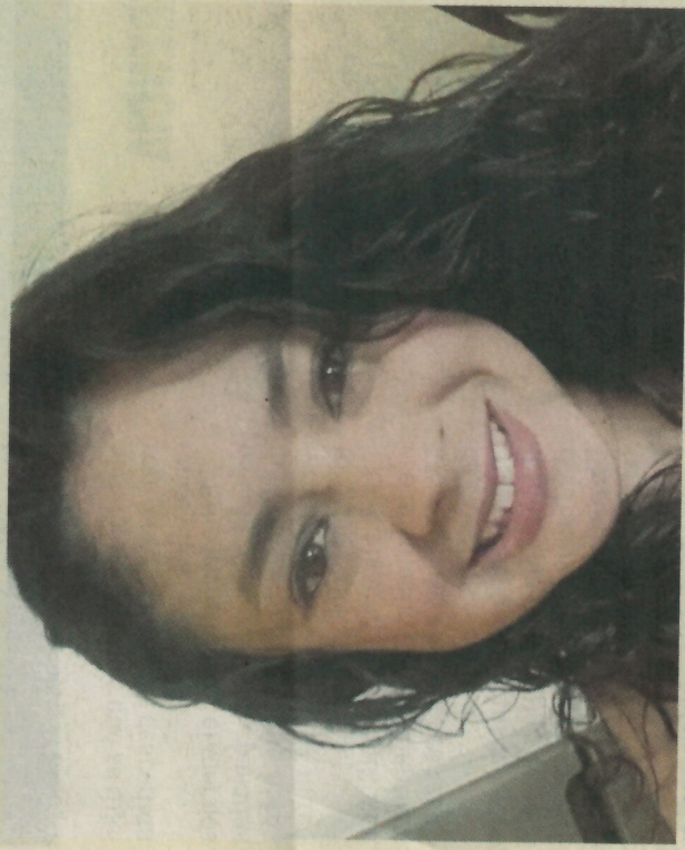
Karla está feliz porque el proceso avanzó rápido.

22 de junio empieza el juicio contra el sospechoso Villarreal