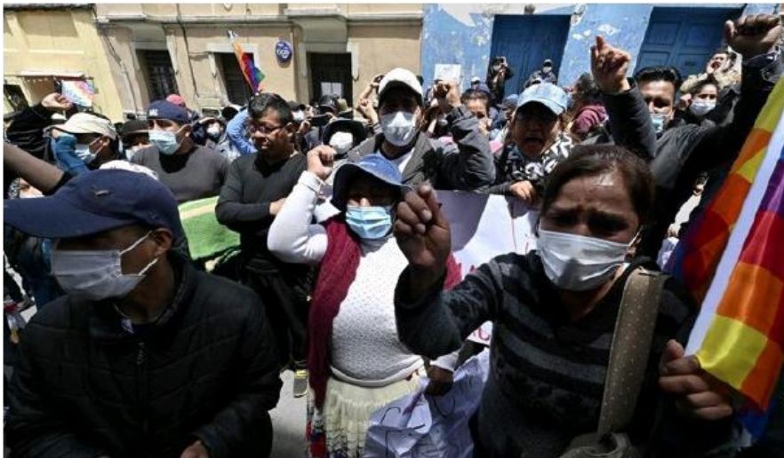
Opositores a la expresidenta interina de Bolivia, Jeanine Áñez, se manifestaron frente a las instalaciones de la Fuerza Especial Contra el Delito (FELCC), donde se encontraba detenida la exmandataria.

Los opositores se organizan contra la decisión de una jueza, a pedido de la Fiscalía, para encarcelar por cua-