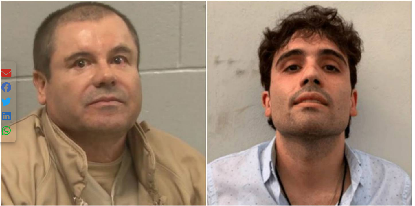
El 'Chapo' Guzmán y uno de sus hijos, Ovidio Guzmán López, quien junto a varios de sus hermanos se encuentra en la lista de los más buscados del FBI.