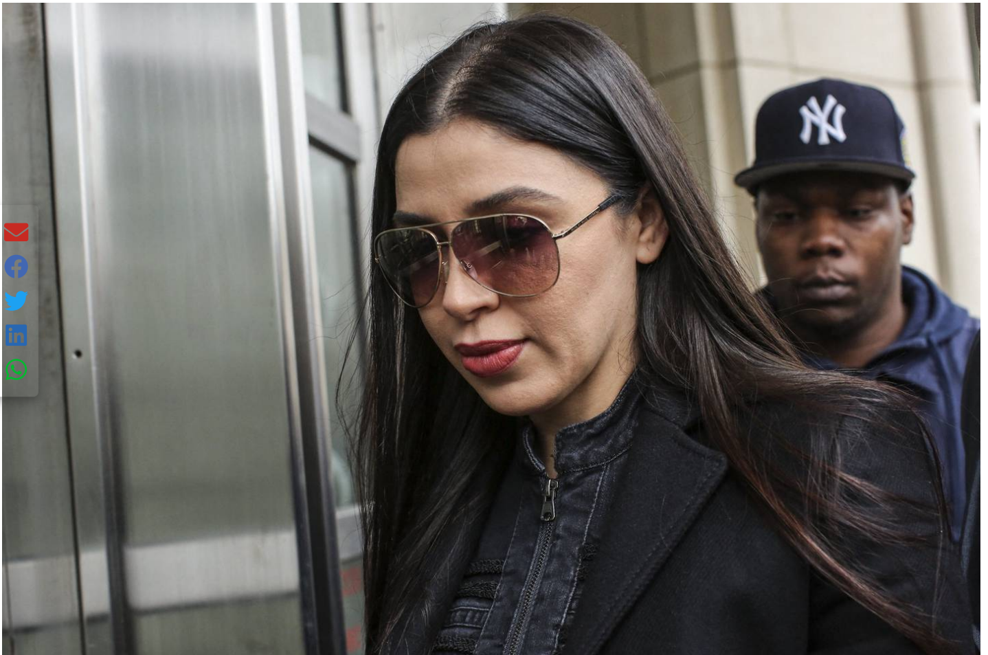
Acá, Emma Coronel arriba a la Corte de Nueva York, en febrero del 2019, para asistir al juicio de su esposo.

Por estos días, después de que transcurrieran más de dos semanas del arresto, la tónica se ha invertido y más bien son muchos los medios y expertos en el tema los que se preguntan cómo es posible que Emma Coronel no hubiera caído antes en las manos de la justicia.