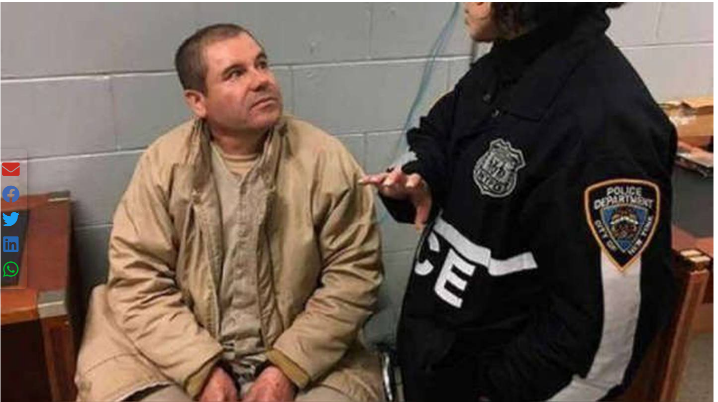
Justamente este miércoles los abogados del Chapo Guzmán emitieron un seriado de quejas por las condiciones "inhumanas" a las que está sometido en la cárcel.