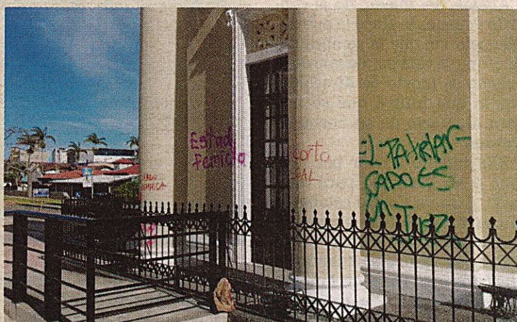
Las responsables quedaron grabadas en cámaras. PODER JUDICIAL