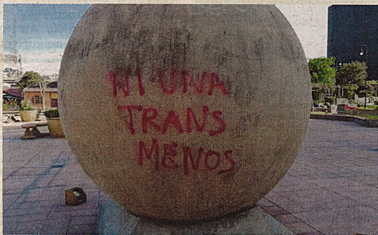
Esta no es la forma correcta de hacerse escuchar. PODER JUDICIAL

Según el artículo 20 de la Ley de Patrimonio Histórico Arquitectónico de Costa Rica, las personas responsables de estos hechos se exponen a una pena de prisión que va de uno a tres años. ▲