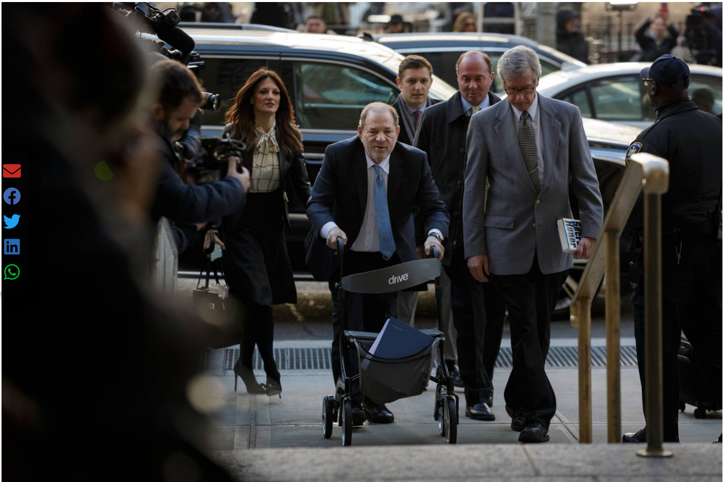
Harvey Weinstein llegó a una de sus audiencias judiciales en Nueva York ayudado por una andadera.