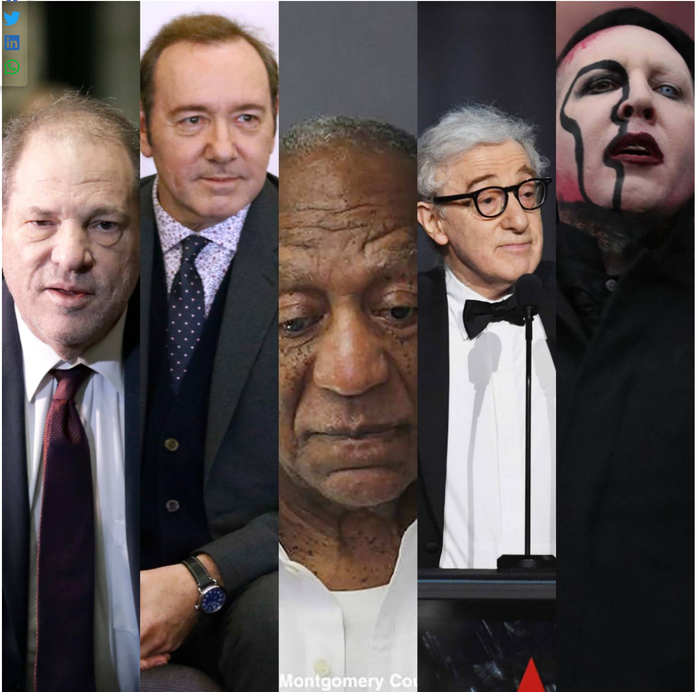
Harvey Weinstein, Kevin Spacey, Bill Cosby, Woody Allen y Marilyn Manson han sido acusados por abusos sexuales.

La última gran estrella de la farándula internacional en protagonizar un escándalo por acosos y abusos sexuales es el cantante Marilyn Manson a quien acusan varias mujeres de torturarlas, manipularlas, violarlas y hasta secuestrarlas. Este nuevo escándalo le echa sal a una herida que no sana en las altas esferas de la farándula y que se extiende a miles y miles de seres humanos que han sufrido de acoso y abuso sexual.