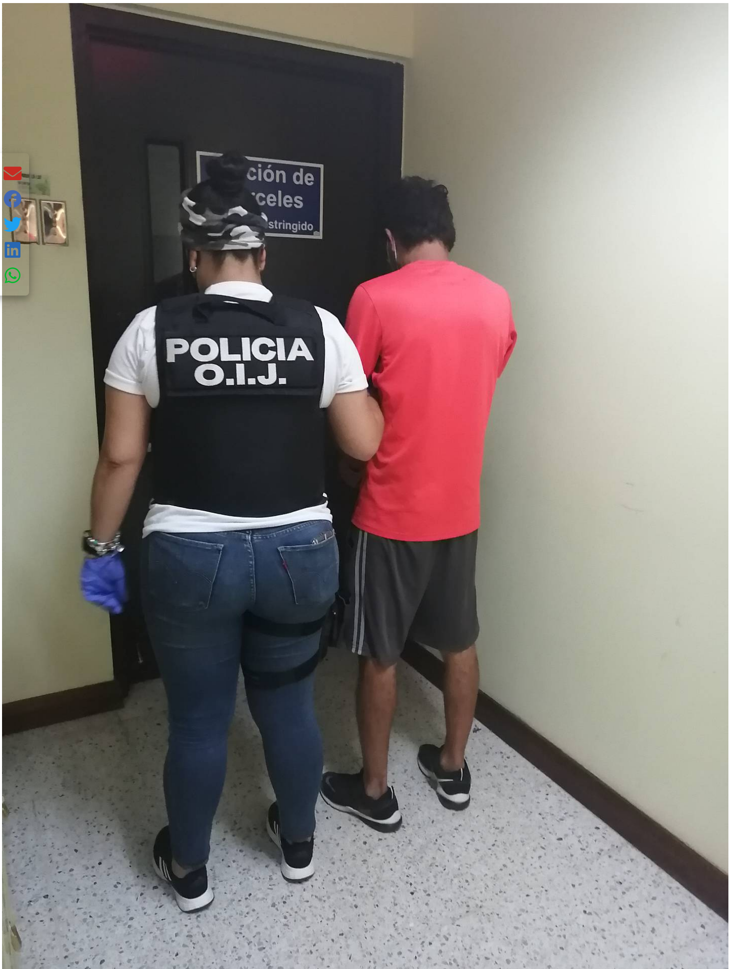
Este hombre de apellidos Navarro Mora fue detenido como sospechoso del asesinato de su esposa, ocurrido hace seis meses en Santa Cruz.

Este martes, el sujeto fue detenido otra vez, cuando realizaba una diligencia en la sede del OIJ de Guápiles, pues aunque estaba libre, se le seguía la causa por el incumplimiento de las medidas de protección y estaba obligado a