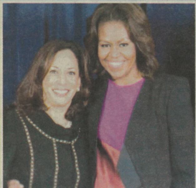
Un gran apoyo en campaña fue la exprimera dama Michelle Obama.