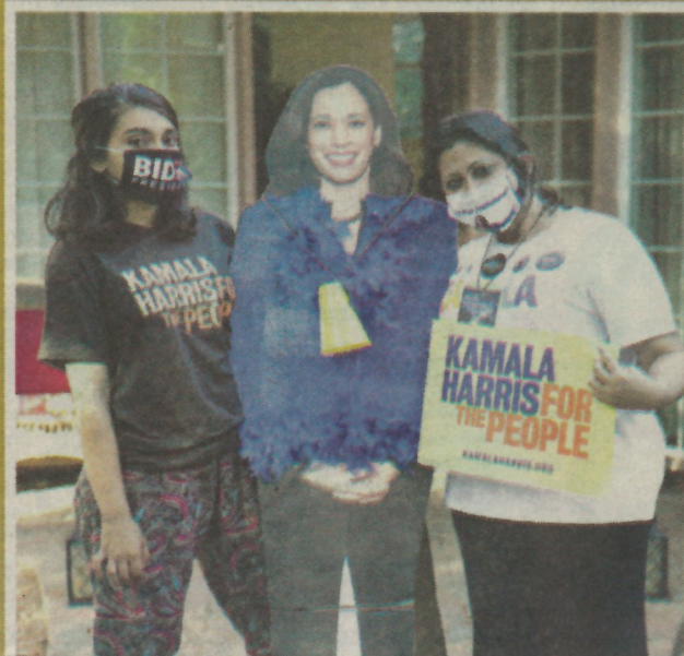
Para las poblaciones negra e hindú fue un honor que Harris las representara.