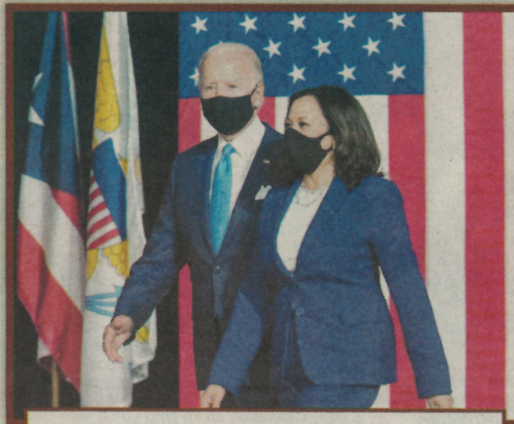
Durante la campaña debieron lidiar con las agresiones verbales de su contrincante.

Años después de ser elegida fiscal la reeligieron y a partir de 2016, luego de derrotar a Letitia