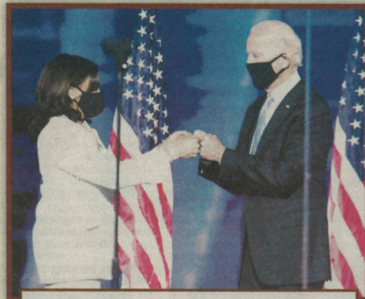
Kamala y Biden constituyen la dupla que guiará el destino de los Estados Unidos.