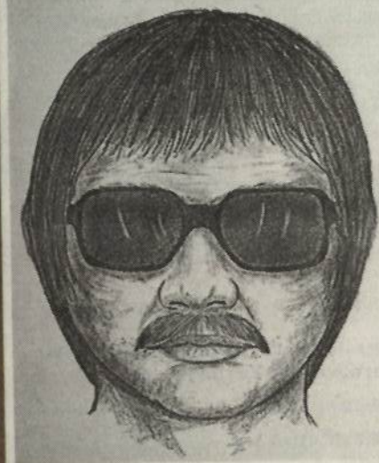
El boceto con el rostro del criminal no se parecía mucho, tal vez por eso no fue tan fácil dar con él.