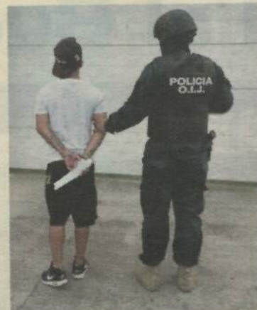
Los detenidos habrían repartido dolor en menos de un día. OIJ

Terror. Los sujetos llegaron a las 2 de la mañana al club nocturno Panter's y a un hotel de paso que está a la par,