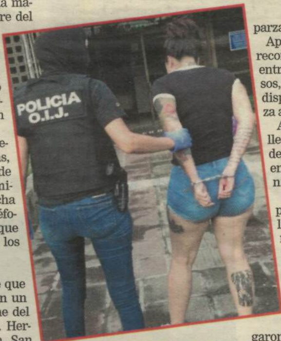
La mujer de apellido Venegas cayó en Jacó. OIJ