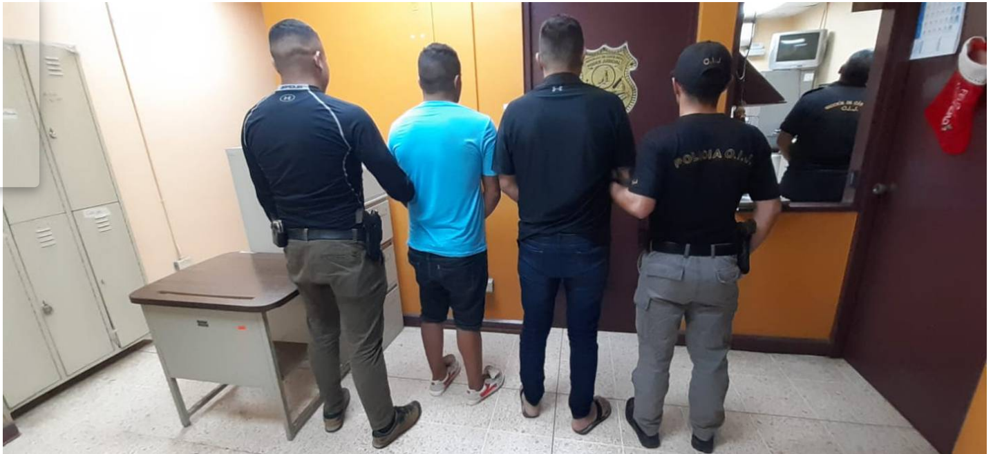
Los cinco sospechosos fueron detenidos a las 10 p. m. de este sábado.

Asimismo, sus colaboradores se apellidan Ramírez (27 años), Correa (29), Winter (29) y una mujer de apellido Ortiz (39).