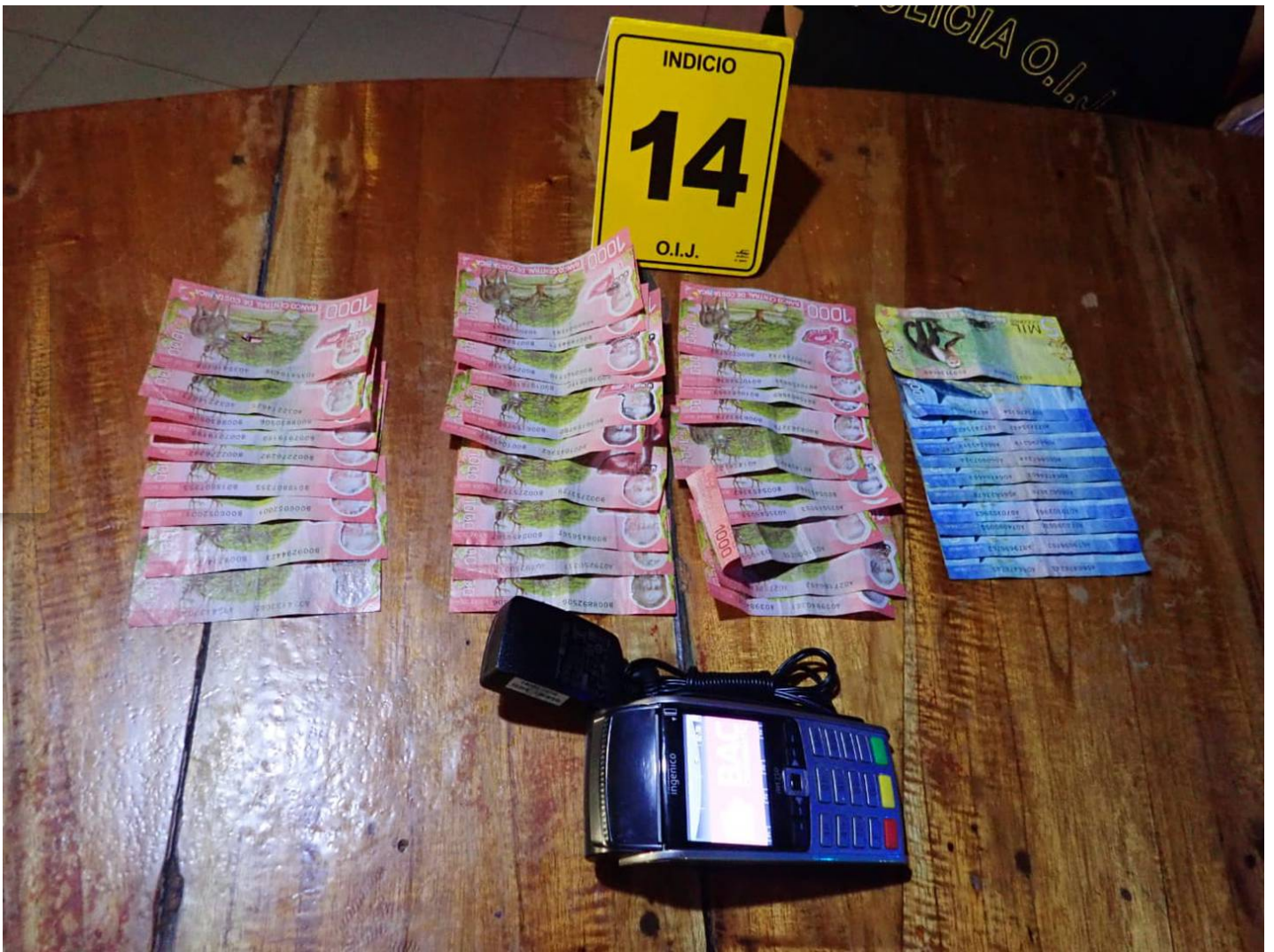
Dinero decomisado en el sitio.