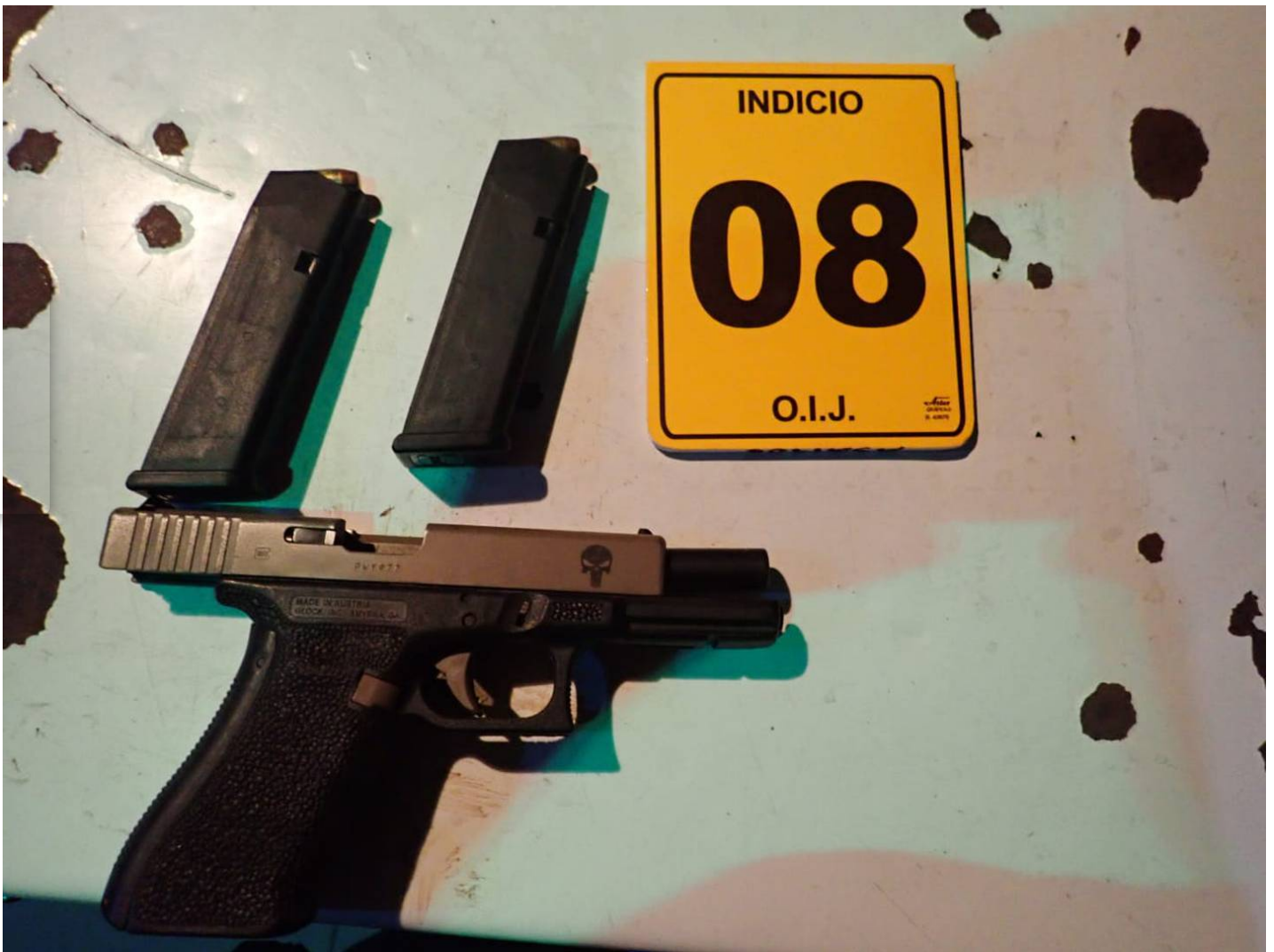
En el lugar se hallaron dos armas de fuego, dinero y documentación.

El OIJ inició la investigación tras recibir una denuncia de que en el night club existía una red de proxenetismo.