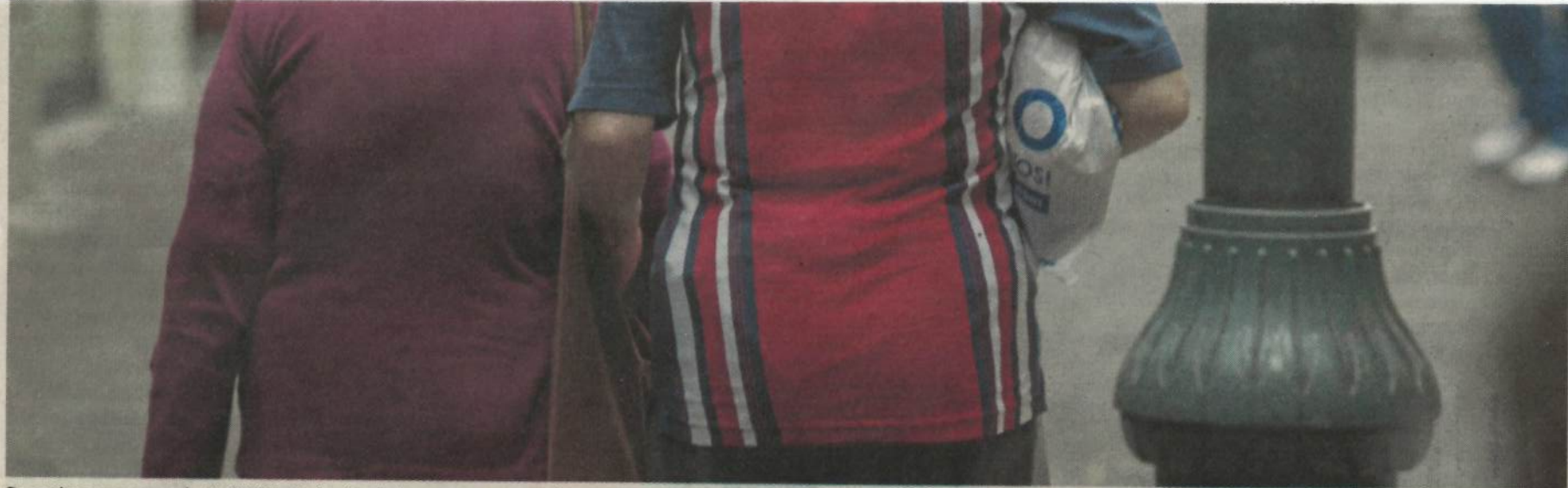
Se estima que para el año 2050 habrá más adultos mayores que niños en Costa Rica. Mayela López