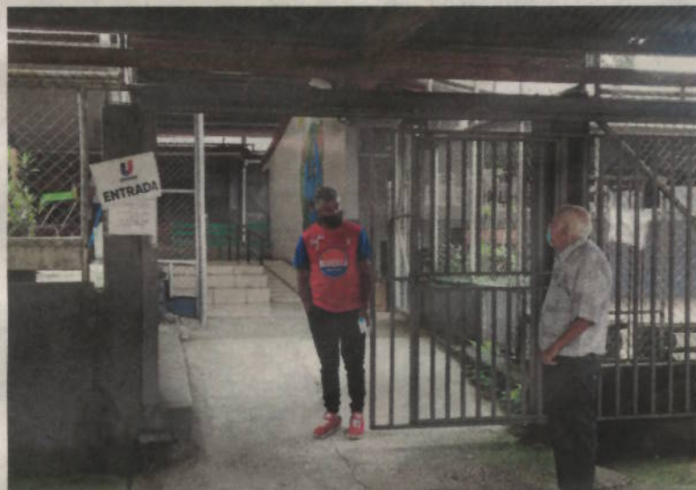
La escuela Julián Volio en El Carmen de Cartago estaba pelada. KEYNA CALDERÓN

“Este es un movimiento que tiene prácticamente tres meses y ese es el resultado que estamos obteniendo, porque esto quiere decir que las personas en este país queremos un cambio, queremos modificar las cosas de cómo se están haciendo, queremos instituciones cercanas a nuestras necesidades, queremos un país debidamente gobernado y con una posibili-