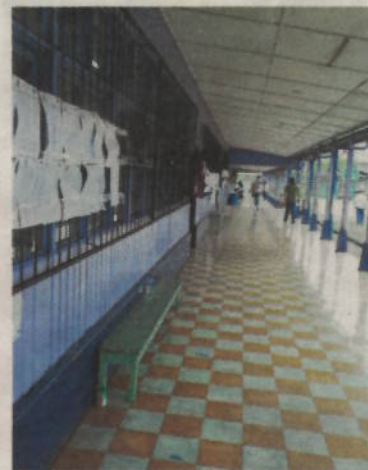
En la Omar Dengo, barrio Cuba, pudo salir un fantasma. EDUARDO VEGA

“La pandemia afecta, el clima afecta porque llovió por la tarde y el tico deja todo para lo último, es un tema cultural, además, los candidatos nunca lograron mover realmente las intenciones de voto, no lograron generar la pasión que se necesita para que