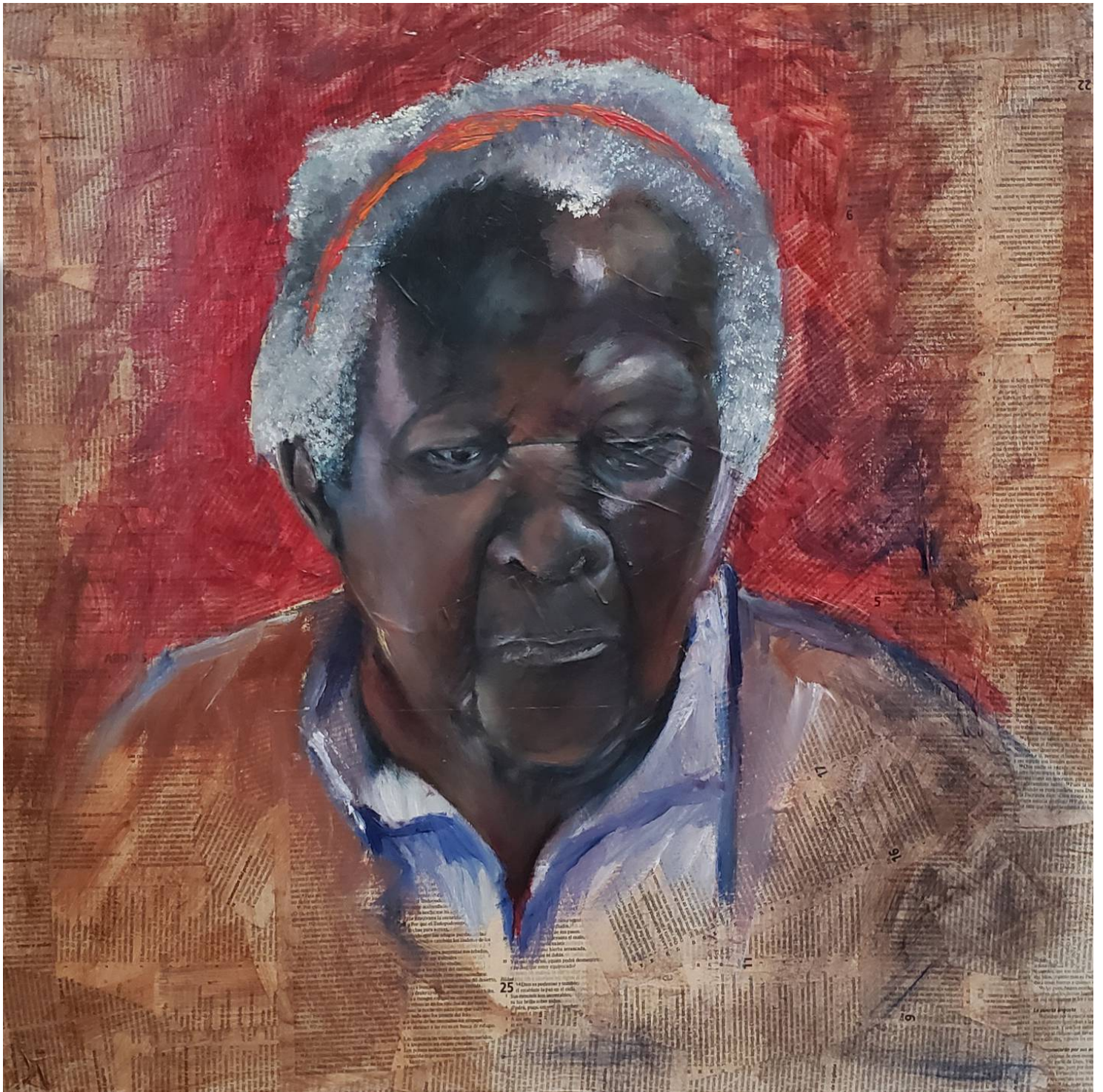
Esta es la obra 'Black Old Lady', de la artista Lorna Loriane.

“Hay momentos particularmente significativos en la vida de una artista; uno de ellos ocurre cuando una idea se convierte en arte, cuando la voz del corazón toma forma material y destella color. Es mi agrado invitar al público en general a mi exposición, que ha sido resultado de una reflexión profunda e investigación sobre algunos aspectos emocionales del proceso del envejecimiento y cuyo fin es generar