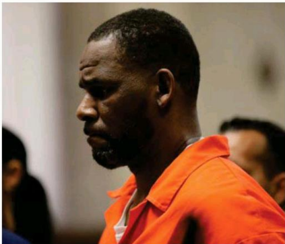
El juicio contra Kelly se aplazó por la pandemia, pero por fin inició.

“R. Kelly es un depredador que utilizó su fama para captar a menores con fines sexuales”, dijeron los fiscales ante un tribunal de Nueva York al iniciarse ayer el tan esperado juicio de la deshonrada