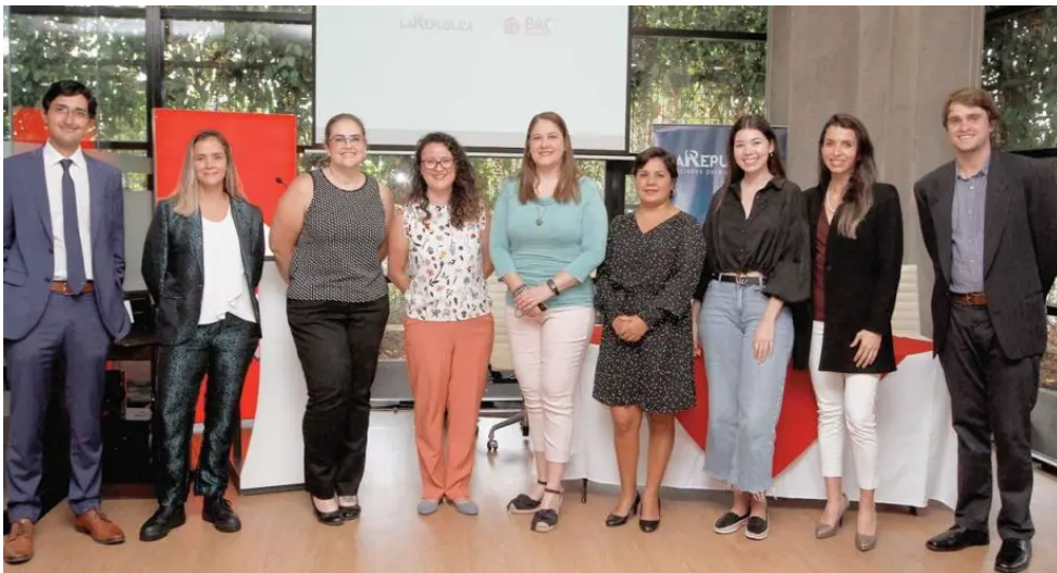
Las ganadoras del concurso Mujer Emprendedora 2022 junto al jurado integrado por representantes de BAC Credomatic, La República y 5e Creative Labs.

Belissa González mgonzalez@larepublica.net | Lunes 09 mayo, 2022