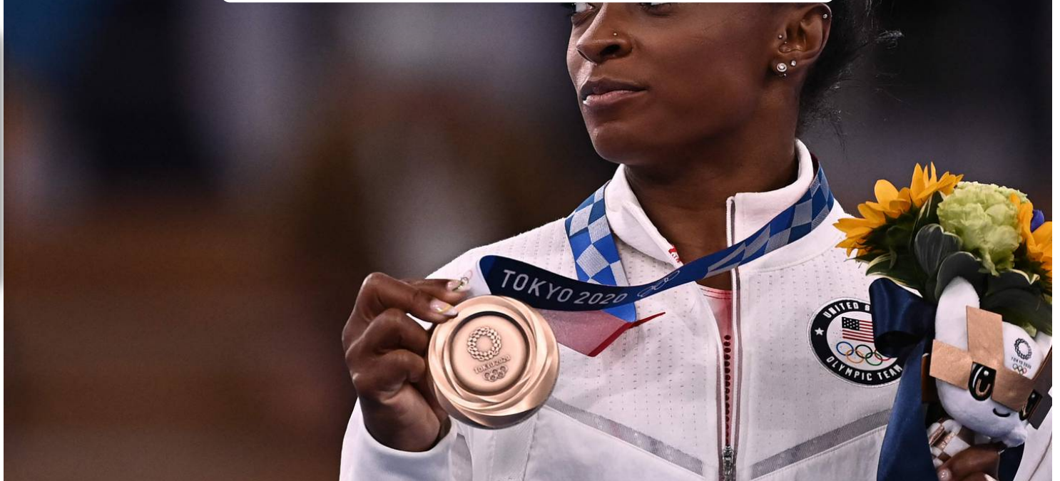
Simone Biles mostró su medalla de bronce.

La estrella estadounidense Simone Biles superó sus problemas de ansiedad para llevarse el bronce en la final de la barra de equilibrio de Tokio 2020 este martes en su vuelta a la competición, mientras la china Guan Chenchen, que se colgó el oro.