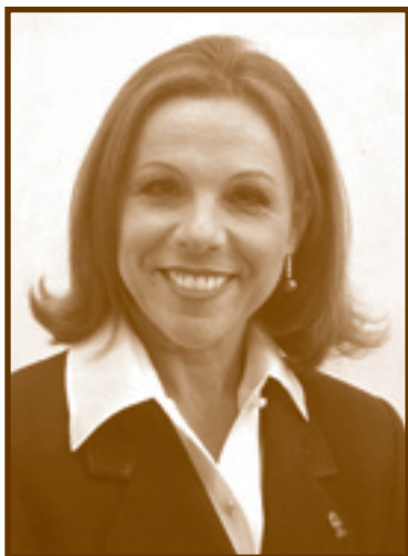
Faingezicht Waisleder Aida