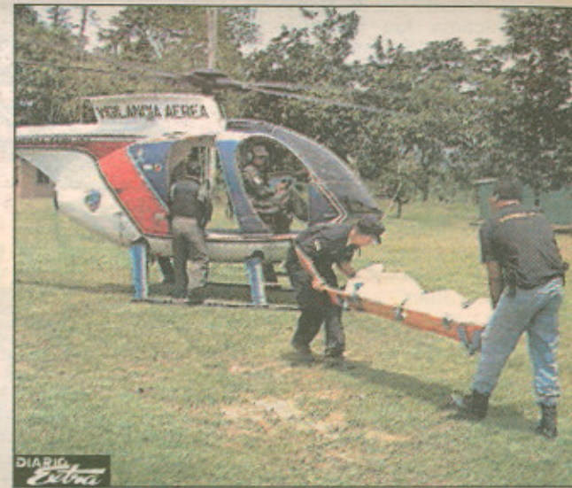
En helicóptero se llevaron el cuerpo de Morales.