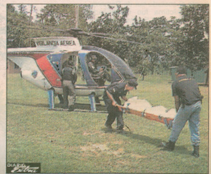
En helicóptero se llevaron el cuerpo de Morales.