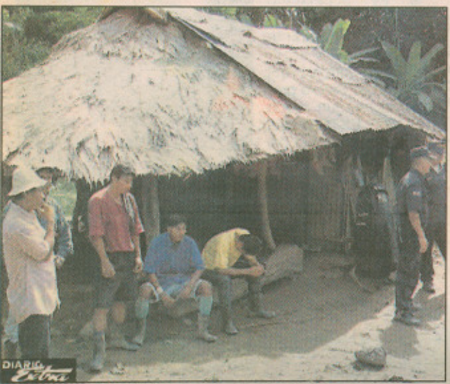
Casa estilo indígena en donde ocurrió el homicidio.