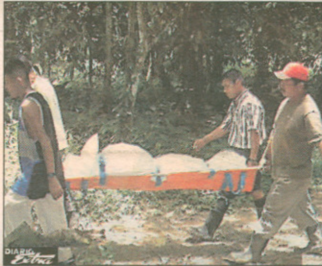
Los familiares llevaron el cuerpo hasta una plaza en donde aterrizó el helicóptero.