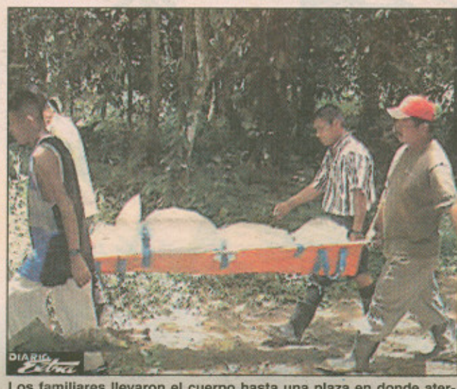
Los familiares llevaron el cuerpo hasta una plaza en donde aterrizó el helicóptero.