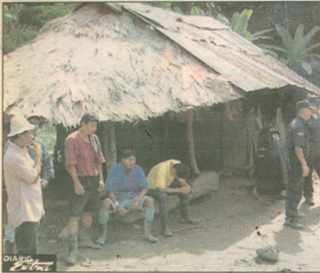
Casa estilo indígena en donde ocurrió el homicidio.