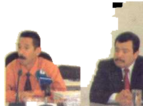
Los jueces aseguraron que las pruebas y testimonios fueron decisivos para la sentencia.

Entre otros de los detalles de la justificación de la sentencia están las constantes denuncias que presentó la ahora occisa contra el hombre ya que en la pareja habían problemas graves y constantes amenazas, lo que deja claro que la muerte de ambas fue producto de la violencia doméstica en la que no le importó