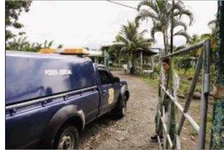
La Policía Judicial ingresó a la 1:45 p. m. al penal La Leticia para recoger el cuerpo de la víctima. José A. Gatgens

Un reo mató ayer a su esposa durante la visita conyugal.