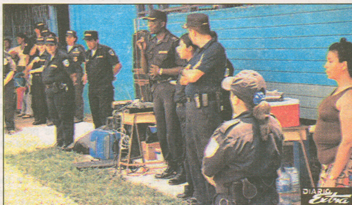
Oficiales de la Fuerza Pública inculcaron a los niños que la policía es su amiga y que los busquen si están en problemas.