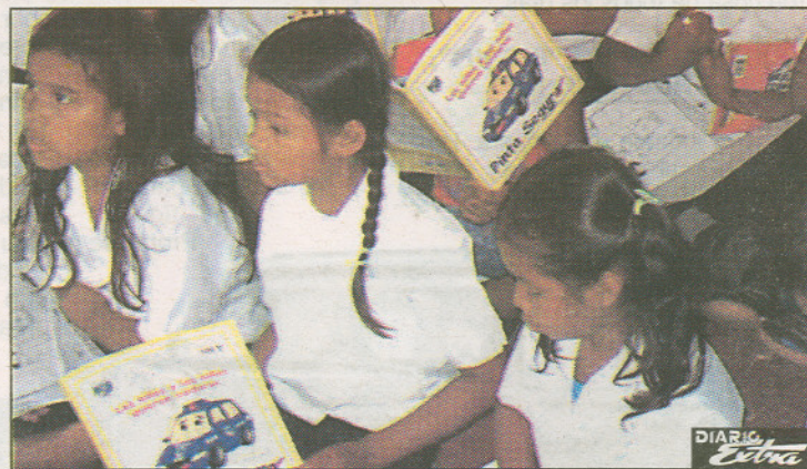
Los niños aprendieron mientras observaban el libro del programa "Pinta Seguro", el cual tiene consejos para su seguridad personal.

Entre las enseñanzas les muestran cómo describir la situación que enfrentan y que deben contárselo al maestro, al director o a la policía si es algún familiar o a la inversa, a los padres si es algún educador.