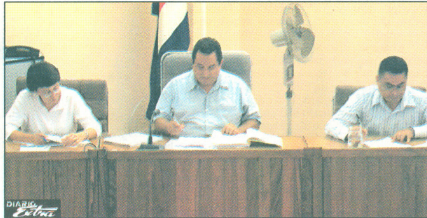
Los jueces condenaron a González por uno de los casos y lo absolvieron de otros nueve.