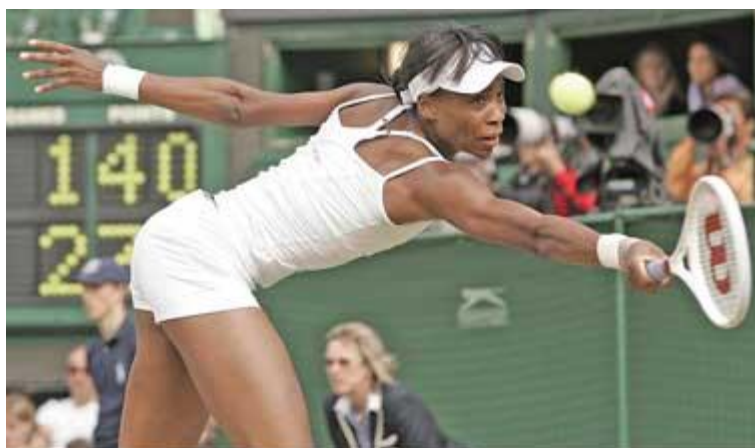
Venus Williams va por su cuarto título de Wimbledon contra la sorpresa del certamen, Marion Bartoli.

La desconocida Marion Bartoli eliminó en semifinales a Justine Henin