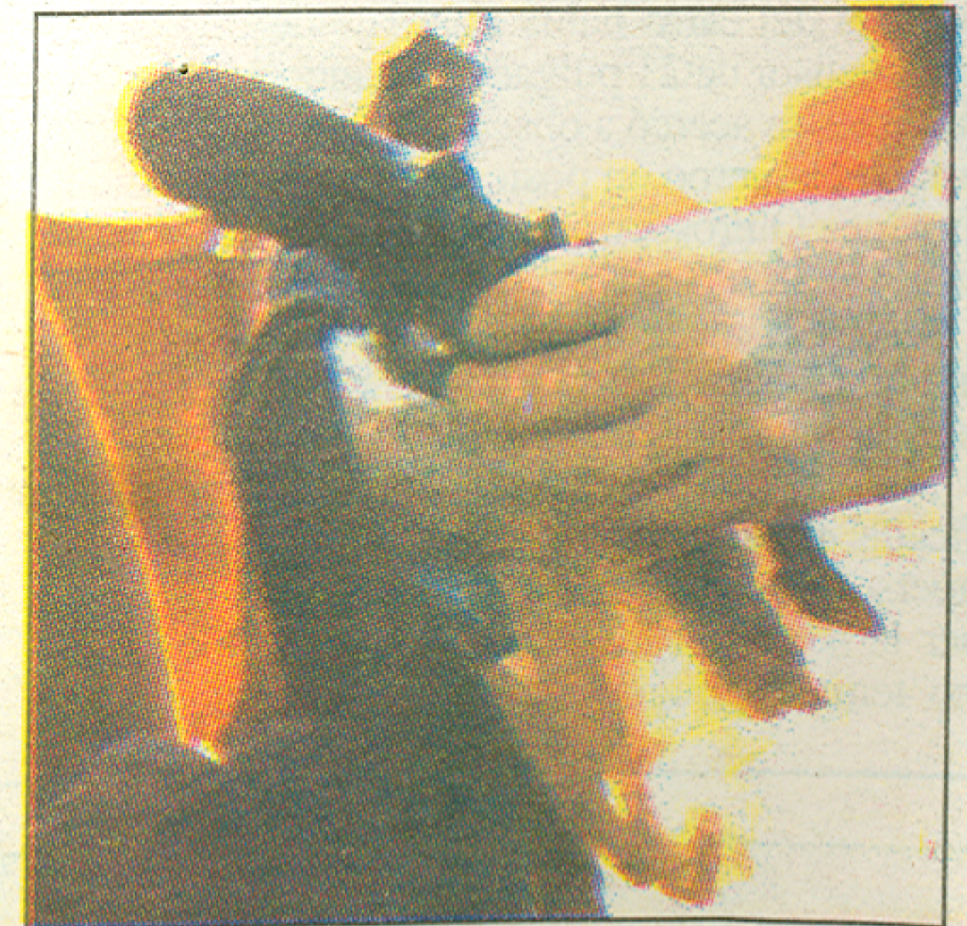
Un oficial de la Policía de Tránsito le quitó el arma al hombre para evitar que lastimara a otra persona.

Al cierre de edición, la mujer se encontraba en la misma condición.