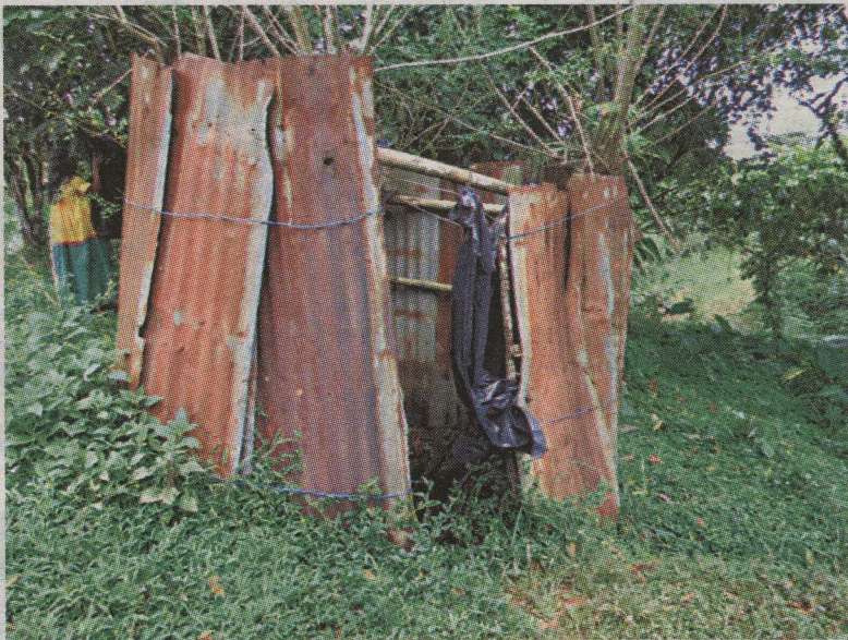
Este es el baño donde estaba la menor cuando la atacaron. ALFONSO QUESADA LT.