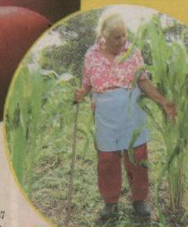
Los productos que siembra esta sancarleña están libres de insecticidas.

Doña María Francisca vive en barrio Lourdes, en San Francisco de La Palmera de San Carlos, y se metió a partera ayudando a una