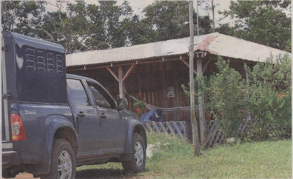
Los agentes buscaban evidencias ayer en toda la propiedad.

Extraoficialmente se indicó que, al parecer, la señora habría forcejeado, esto por el terrible desorden en la vivienda.