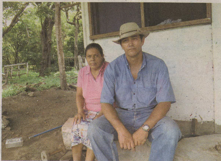
Los abuelos maternos del bebito quieren de vuelta al bebé. CARLOS VARGAS

tiene un concentrado de violencia, ahora se desencadena todo un proceso de investigación”, dijo Orlando Urroz, director del Hospital de Niños.