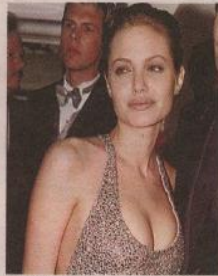
Angelina Jolie se operó los senos para prevenir el cáncer

Según los expertos , entre un 5% y un 10% de los cánceres de mama tienen un origen hereditario que indica la probabilidad de desarrollar la enfermedad a lo largo de la vida hasta en un 70%, por lo que recomiendan la mastectomía preventiva. Esta cirugía disminuye hasta un 95% el riesgo a padecer de cáncer de mama.